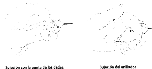
Sujeción con la punta de los dedos

Figura 1 técnica de sujeción para la manipulación de los colibríes capturados con la punta de los dedos