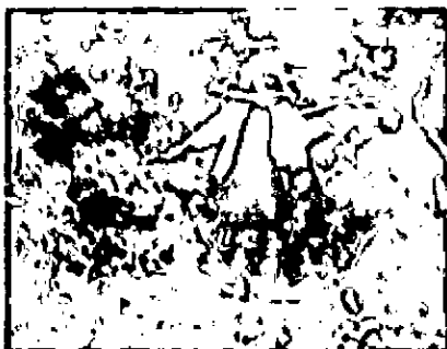
Fig 2 Propietaria RNSC San Martín

De acuerdo a la información suministrada por el propietario y el estudio de inventados de flora y fauna del Santuario de Flora Fauna Galeras se relacionan los listados de las principales especies de flora y fauna.