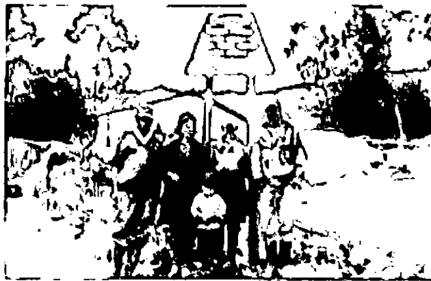
Fig. 6 Familia propietaria RNSC San Martín