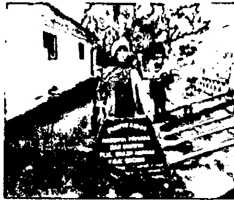
Fig. 5 Elaboración de señalización de RNSC San Martín