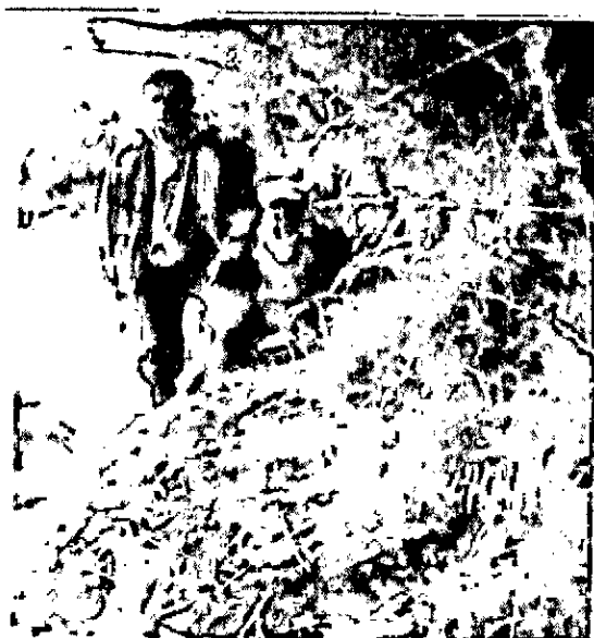
Fig. 7 Zona de conservación RNSC San Martín-Arriente

Según el programa de monitoreo del SFF Galeras las aves como valores objeto de conservación del Santuario, son importantes participantes en el flujo de información y materia que se da en los ecosistemas, donde tienen especial relevancia llevando a cabo las funciones de polinización y dispersión de semillas. Esta característica ecológica hace de las aves un grupo vital para el mantenimiento de la diversidad genética en las comunidades de plantas, garantizando la reproducción sexual de muchas especies, al igual que los procesos de colonización de nuevos espacios y la restauración de los hábitats 2 .