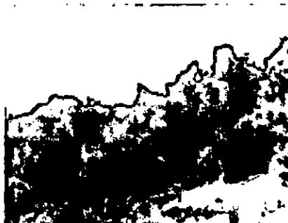
Fig 3 Zona de conservación RNSC San Martín