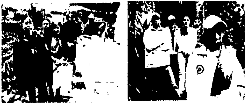
Fig. 12 Jornadas de avance del plan de manejo de la RNSC San Martín

La propuesta de zona con función amortiguadora, para el municipio de Tangua tiene una extensión de 844 ha; dentro de ésta se destaca la sub zona de conservación con 13 reservas privadas (incluida la RNSC San Martín) para el municipio como corredores de conservación que suman una extensión de 40,57 ha en bosques nativos y 23,44 ha en producción. Esto suma a la propuesta de función amortiguadora alrededor del SFF Galeras de 10.186 ha (área total) y donde se encuentran más de 10 iniciativas privadas de conservación para 5 municipios incluyendo Tangua.