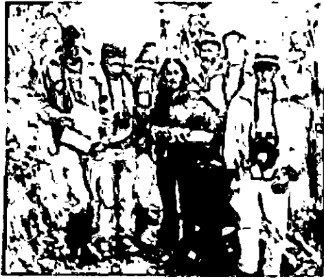
Fig. 4 Participación de p.o. de RN En taller sobre avistamiento de aves