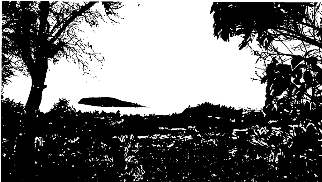
Imagen 1. Vista general desde el costado nor-oriental del Humedal Ramsar Laguna de La Cocha, con el Santuario de Fauna y Flora Isla de La Corota. Fotografía tomada durante el ascenso en cercanías al predio MIRAFLOREZ.

Cerro de Patascoy, declarada mediante acuerdos No. 005 de 1971 y No. 058 de 1973 y resoluciones ejecutivas No. 231 de 1971 y No. 073 de 1974 del Ministerio de Agricultura.