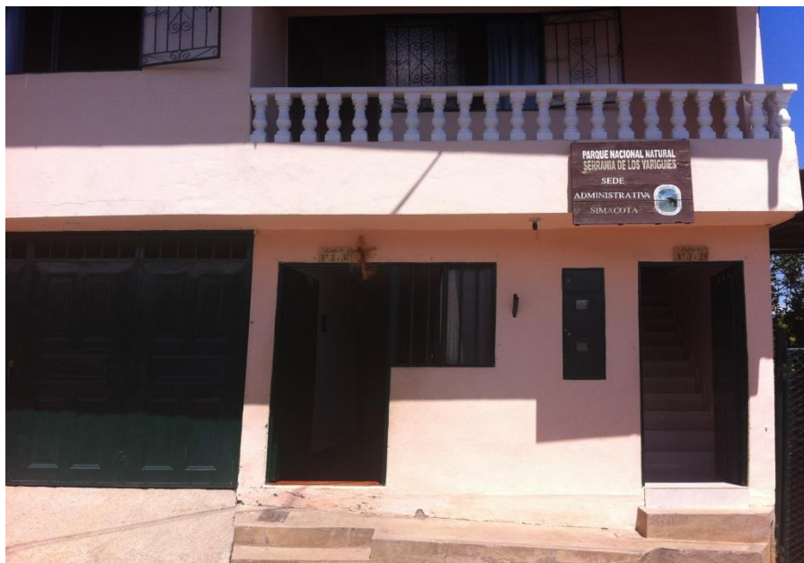
FOTO: Sede Administrativa del PNN Serranía de Los Yariquíes Simacota - Santander

La sede administrativa del PNN Serranía de Los Yariquíes se encuentra ubicada en el municipio de Simacota – Santander, es de aclarar que el inmueble es en arriendo, se verifica las condiciones adecuadas en cuanto a iluminación, humedad, ventilación y ubicación de los puestos de trabajo. Así mismo el PNN cuenta con cuatro (4) sedes operativas distribuidas en los municipios de El Carmen de Chucurí, San Vicente de Chucurí, Santa Helena del Opón y Galán. Es de aclarar que por presupuesto y tiempo se desconocen el estado de las mismas.