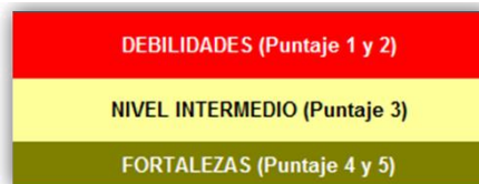
Imagen 2: Rango de Valores para Priorizar las Necesidades y Fortalezas de Manejo de AP (AEMAPPS 2013).