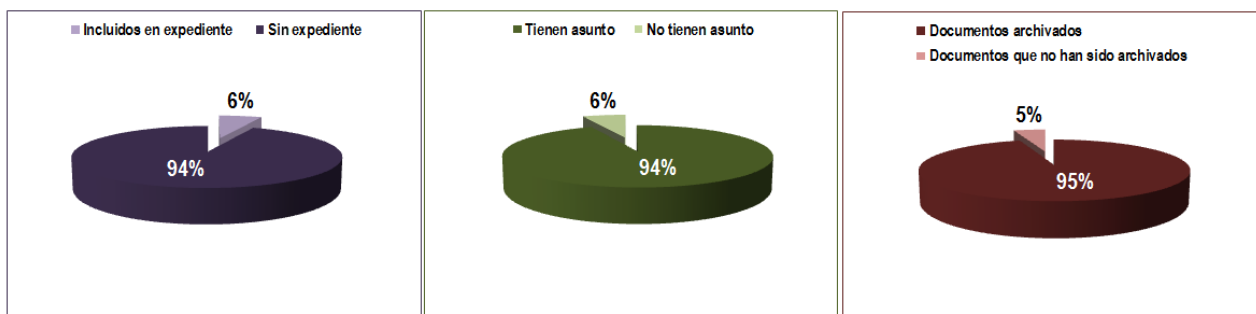
GESTOR DOCUMENTAL PNN Complejo Volcánico Doña Juana Cascabel V.2014

Cada uno de los ítems observados, será objeto de análisis detallado en el presente informe.