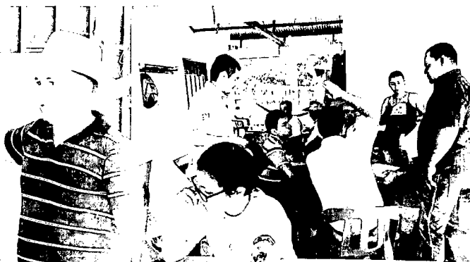
Imagen 2. Taller Ordenamiento