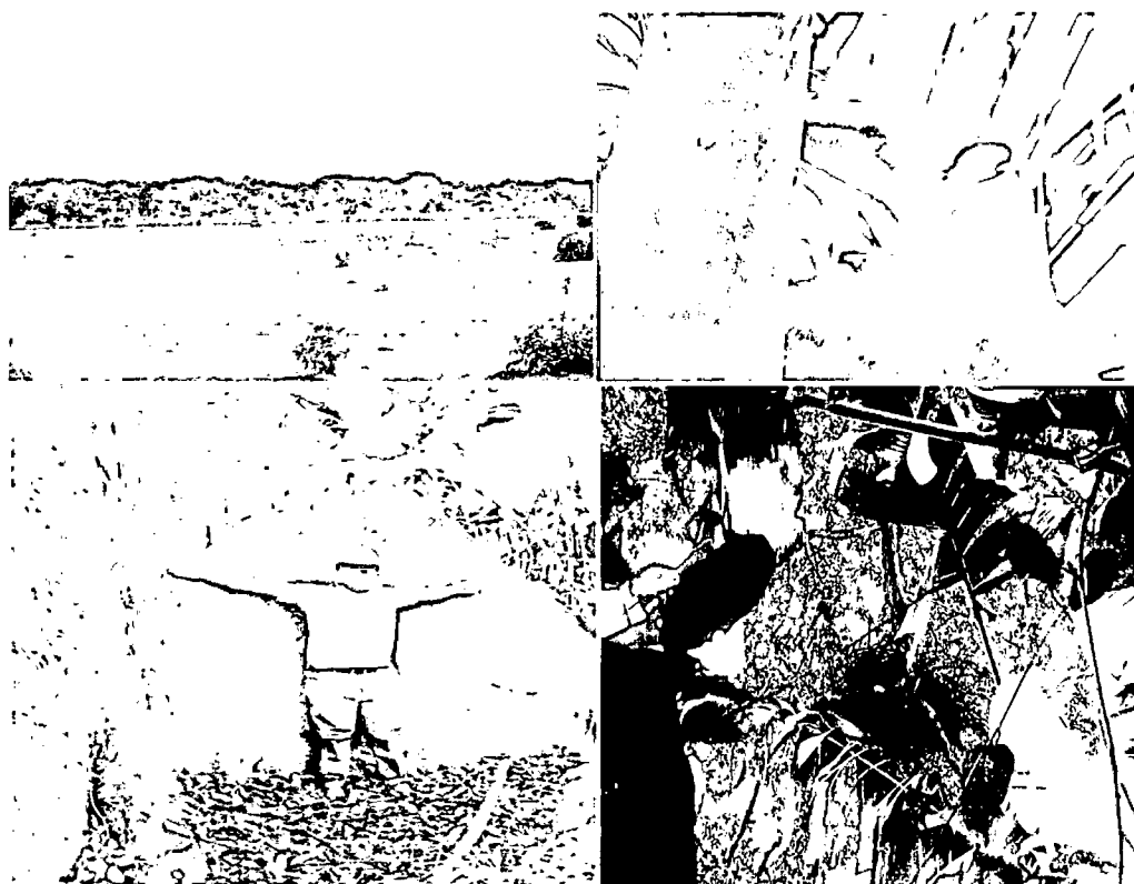
Imagen 3. Zona de conservación RNSC El Lagunazo en Santa Clara

La nueva zona de conservación se encuentra asociada a una muestra de ecosistema natural. Los ecosistemas presentes en la zona de conservación son (i) bosque de galería temporalmente inundable (ii) sabana inundable con influencia eólica, (iii) morichales y (iv) esteros, todos en buen estado de conservación. En el recorrido se identificó la especie Alouatta seniculus conocido como Araguato. (LC) dado que en el recorrido se evidenció el aullido, el estiércol y el tipo de alimentación que consume la especie en la región.