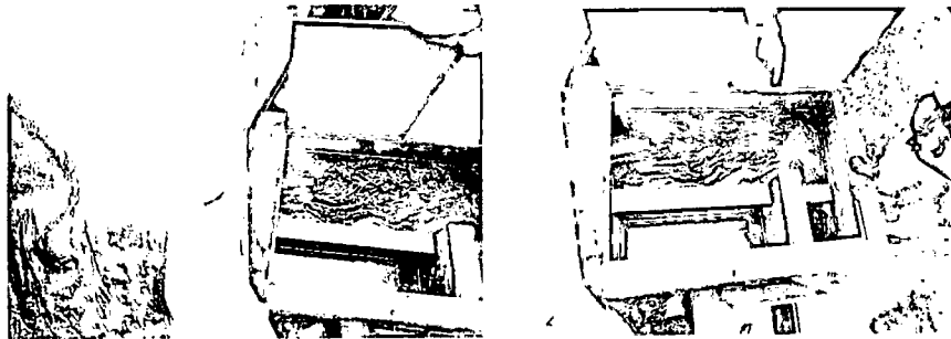
Imagen 3 y 4 Bocatoma

La bocatoma se hace a través de una rejilla sumergida de 60 cm * 25 cm, la cual conduce el recurso a una caja de inspección que contiene 3 compartimientos, uno de almacenamiento, otro de retorno a la quebrada y el restante que lleva el agua hasta el desarenador aproximadamente 150 mts. aguas abajo.