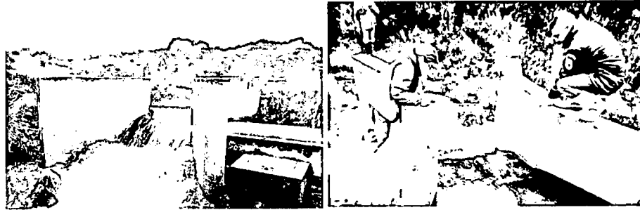
Imagen 1 y 2. Vertedero aforado

El otorgamiento de la concesión objeto del presente concepto técnico no generará una disminución considerable al caudal de la fuente hídrica, toda vez que se otorgará el 3.5% del total del caudal aforado y por lo tanto no afectará el estudio de las futuras solicitudes y se garantiza el caudal ecológico de la fuente hídrica.