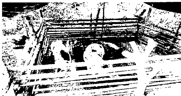
Imagen 5. Corral de cerdos en el predio El Triunfo.

Actualmente, el propietario tiene 2 marranos, 15 pollos y 2 vacas, de los cuales obtiene carne, huevos y leche para el sustento diario. Además, distribuidos dentro del predio, específicamente cerca de las viviendas se hallan dispersos árboles y arbustos frutales de arazá, borojó, guayaba y copozú cuyos frutos son utilizados en la elaboración de jugos y mermeladas.