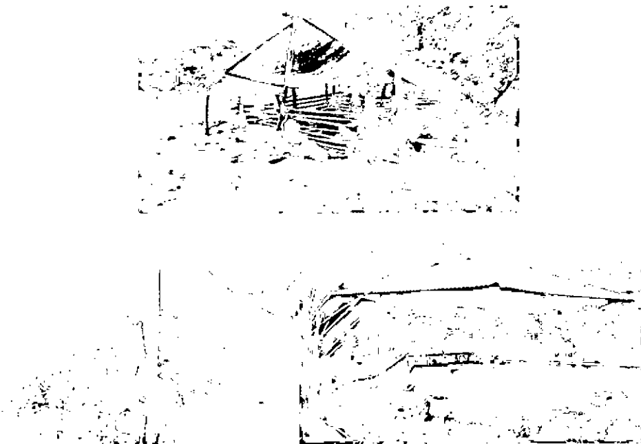
Imagen 7. A. Depósito de madera. B. Corral de cerdos. C. Kiosko.

Existen otras estructuras dentro de la finca como una marranera de 9 m 2 (que en el momento alberga solo una pareja de marranos, y se encuentra dentro de la zona de conservación), un corral para pollos de 16 m 2 (que cuenta con 10 (diez) gallinas y dos (2) gallos), un deshidratador de aromáticas de 12 m 2 , un secador de arroz de 12 m 2 , un cuarto forrado con plástico negro de 16 m 2 en donde guardan la madera para evitar que se humedezca y un kiosco de 16 m 2 , lugar en donde se llevan a cabo las reuniones de la junta de acción comunal de la vereda Ancurá y que pretende convertirse en un vivero para la siembra de plantas nativas (Imagen 7). Los recursos para la construcción del secador de arroz, el deshidratador de aromáticas y el kiosco fueron conferidos por la Comisión de Justicia y Paz, organización sin ánimo de lucro que contribuye y procura por el desarrollo y tecnificación de los campesinos de la vereda.