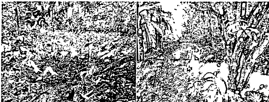
Imagen 1. Izquierda: Zona de inundación de la quebrada Acurá. Derecha: Bosque ripario de la quebrada Acurá.

que incluye en el dosel y subdosel árboles de 10 a 20 metros de altura de Madroño y Palmas, y como emergentes árboles de Amarillo que superan los 20 metros y están cubiertos en la mayor parte del tronco por epifitas (Bromelias y Orquídeas). El sotobosque, presente en la mayor parte del predio, está conformado por vegetación secundaria en estadios de sucesión tempranos y en la zona de inundación de la quebrada Acurá por una densa cobertura vegetal de Aráceas y Heliconias.