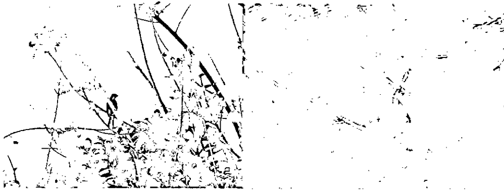
Imagen 2. Especies de aves observadas durante la visita técnica al predio El Triunfo. Izquierda: Ramphocelus nigrogularis . Derecha: Crotophaga ani .

Según el listado de especies suministrado por la Herramienta Tremarctos Colombia 3.0 18 , para la zona se reportan cinco (5) especies de reptiles (Tabla 3), de las cuales: Kinosternon scorpioides es endémica y aparece reportada como casi amenazada (NT), mientras que Peltocephalus dumeriliana , Podocnemis sextuberculata y Podocnemis unifilis están clasificadas como Vulnerable (VU) y Podocnemis expansa se encuentra en la categoría de preocupación menor (LC).