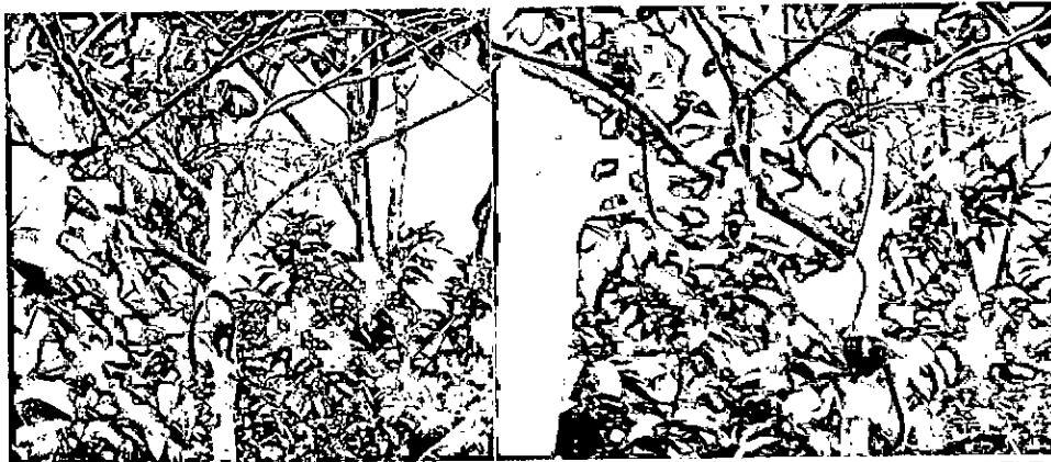
Imagen 3. Especies de primates ( Saguinus nigricollis ) observadas durante la visita técnica al El Triunfo.

Según la IUCN y la Resolución 0192 de 2014 la especie Myrmecophaga tridactyla se encuentra en categoría de amenaza vulnerable (VU), mientras que las especies Lontra longicaudis y Panthera onca están incluidas en la categoría de Casi Amenazada (NT) de la IUCN y aparecen reportadas como Vulnerable (VU) en la resolución 0192 de 2014. Las demás especies relacionadas en la tabla 4 se encuentran reportadas en la categoría de Preocupación menor (LC) o no aparecen en el listado de IUCN, ni tampoco se encuentran incluidas en la Resolución 0192 de 2014.