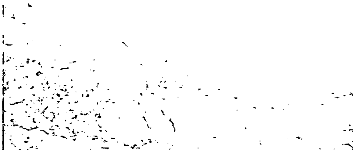
Registro fotográfico del área, predio El Maná. Zona de Conservación.

"(...) Según la clasificación de zonas de vida propuesto por holdridge el predio se encuentra en un bosque húmedo premontano (bh-PM), caracterizado por una precipitación anual multianual de 2411 mm y una temperatura promedio de 18 °C. El área de conservación crea una protección aferente al Rio Buey, siendo una transición entre el hábitat terrestre y acuático, la vegetación asociada a esta área se denomina vegetación ribereña (...).