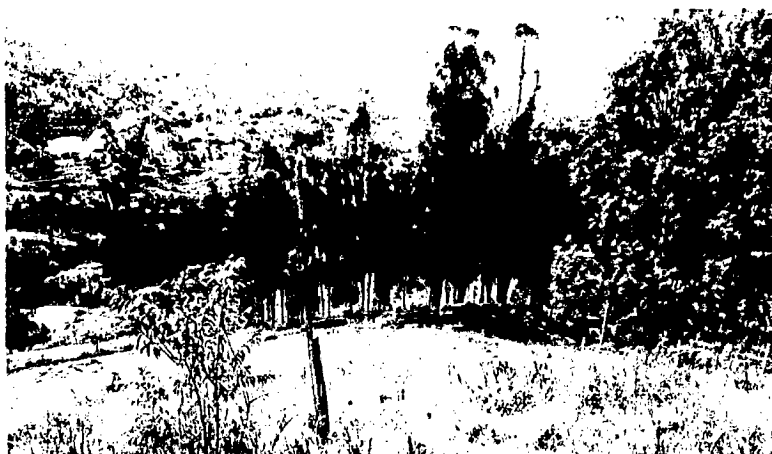
Imagen No. 1: Panorámica de los predios.

(Primulaceae), Oreopanax incisus (Araliaceae) y Salix humboldtiana (Salicaceae). Se destaca la presencia de epífitas como Orquídeas ( Comporettia macroplectron ), Bromelias ( Racinaea sp.) y canelones o cordoncillos ( Peperomia sp.). Existen también individuos no arbóreos de especies como Rubus sp. (Rosaceae), Pteridium arachnoideum (Dennstaedtiaceae), Aphelandra sp. (Acanthaceae), Castilleja arvensis (Orobanchaceae), Carex sp. (Cyperaceae), y Anthoxanthum odoratum (Poaceae). (...). (Folio 66)