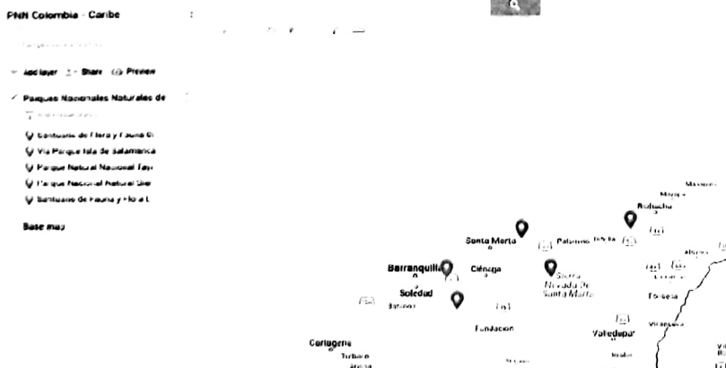
Ilustración 2 Puntos de la ruta Jurisdicción de PNN