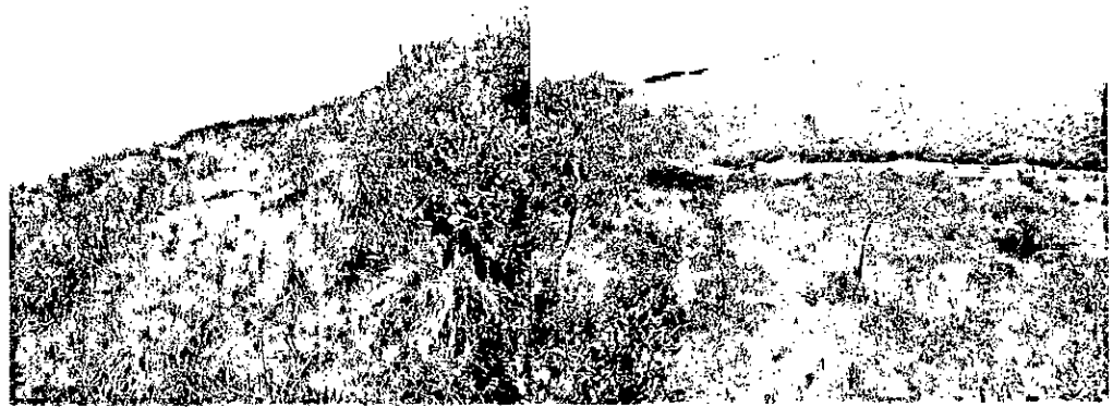
Zona de Agrosistemas – potreros enrastrados RNSC La Miranda (Fuente: visita técnica PNN septiembre 20 de 2017).