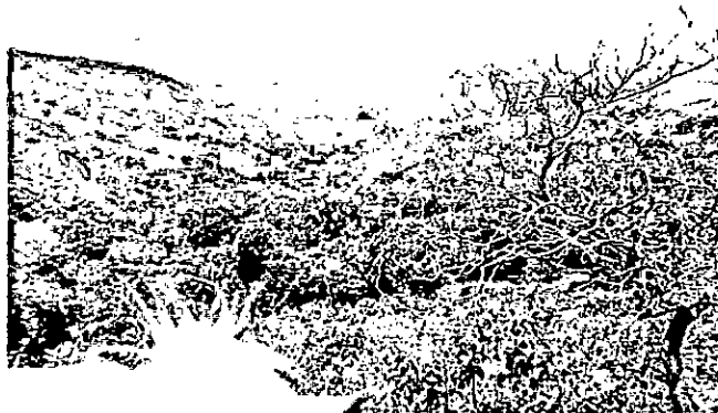
Zona de Conservación bosque seco Tropical RNSC La Miranda (Fuente: visita técnica PNN septiembre 20 de 2017).