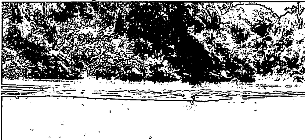
Imagen No. 2: Nutrias - RNSC "PADROTE 2".