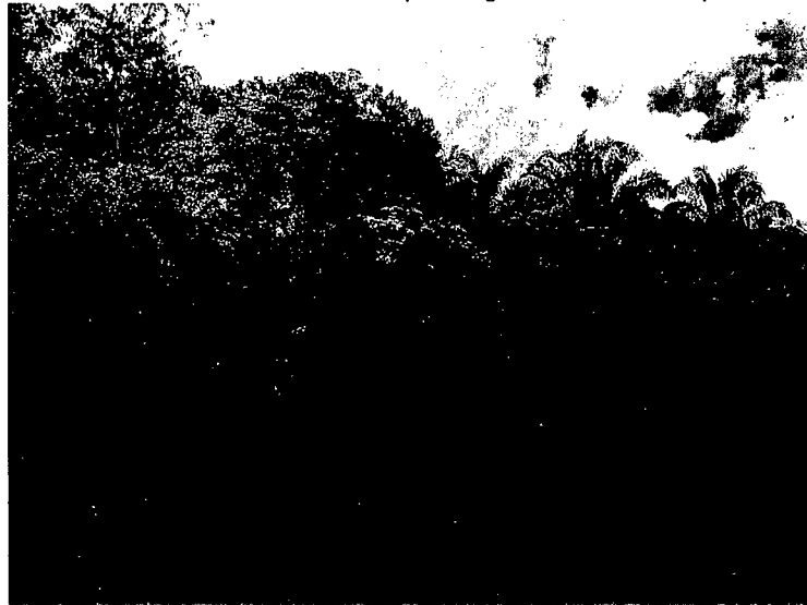
Imagen No. 1: Muestra de ecosistema de "Bosque de galería Inundable" presente en la reserva.

La muestra de ecosistema presente en el predio "Padrote Dos" posee una importante conectividad ecológica con las Reservas Naturales de la Sociedad Civil vecinas permitiendo la función ecosistémica relacionada con la regulación del clima, la protección y regulación del recurso hídrico, la retención de nutrientes y la provisión de condiciones apropiadas para el desarrollo de poblaciones de especies de fauna y flora.