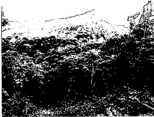
Foto 1. Elaboración de panela en el predio El Paraiso Foto 2. Panorámica del predio