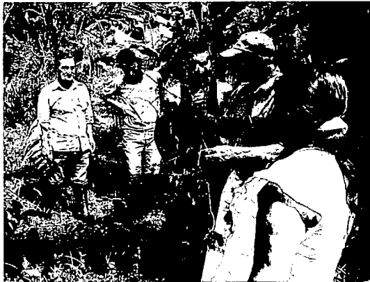
Foto 5. Recorrido de caracterización con la comunidad, reconocimiento de plantas de uso medicinal