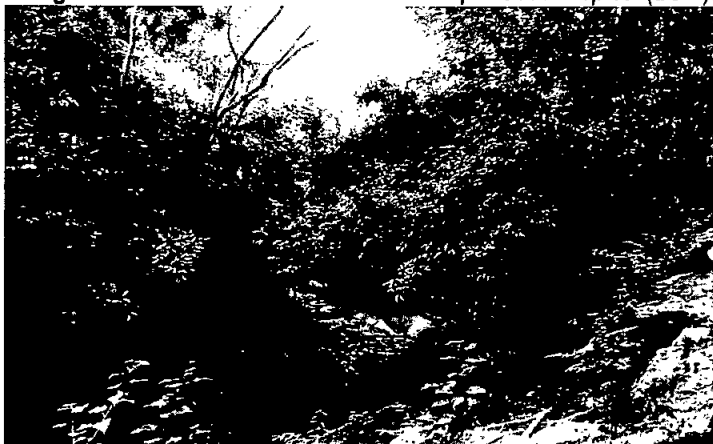
Imagen No 1: Muestra de ecosistema Bosque Seco Tropical (Bs-T).

Teniendo como referencia la clasificación de zonas de vida de Holdridge el predio La Garita posee una muestra de ecosistema correspondiente a Bosque Seco Tropical (Bs-T) alterno hídrico; dicho bosque se encuentra en restauración pasiva, cuenta con relictos de bosque secundario en proceso de desarrollo en buen estado de conservación.