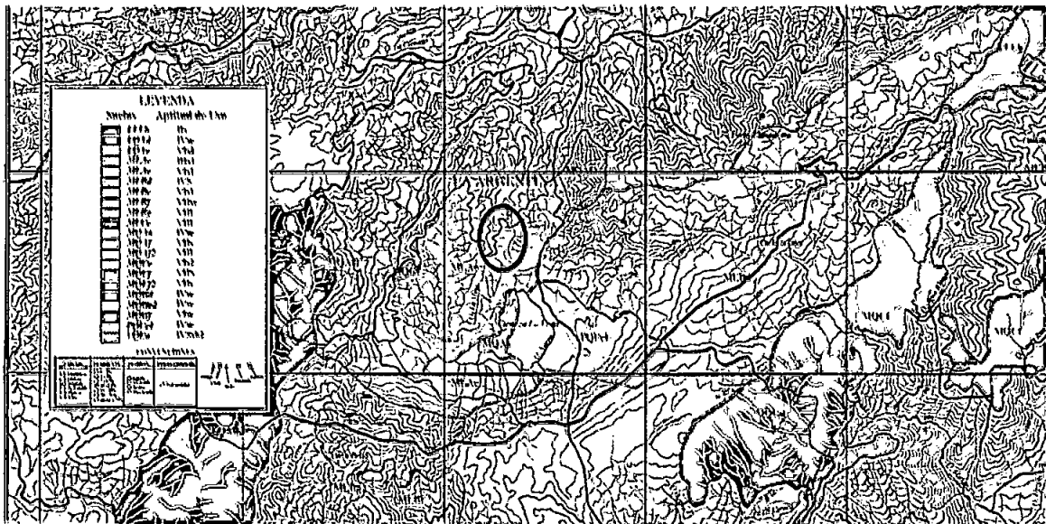
Mapa de suelos.

MLAe Suelos de relieve fuertemente quebrado y pendientes 25-50%.