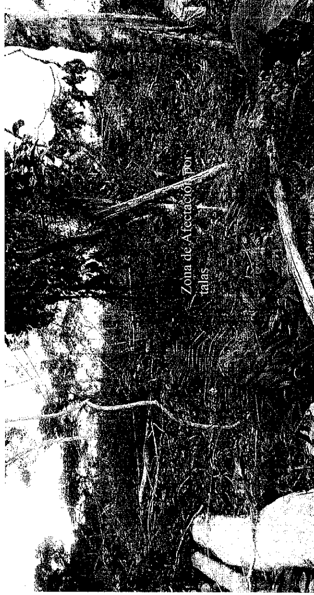
Tala de aproximadamente 12 hectáreas coordenadas N 2°38'36.26" W 73°43'24.70" sector vereda Caño animas - "Sendero Ecológico por la Paz"