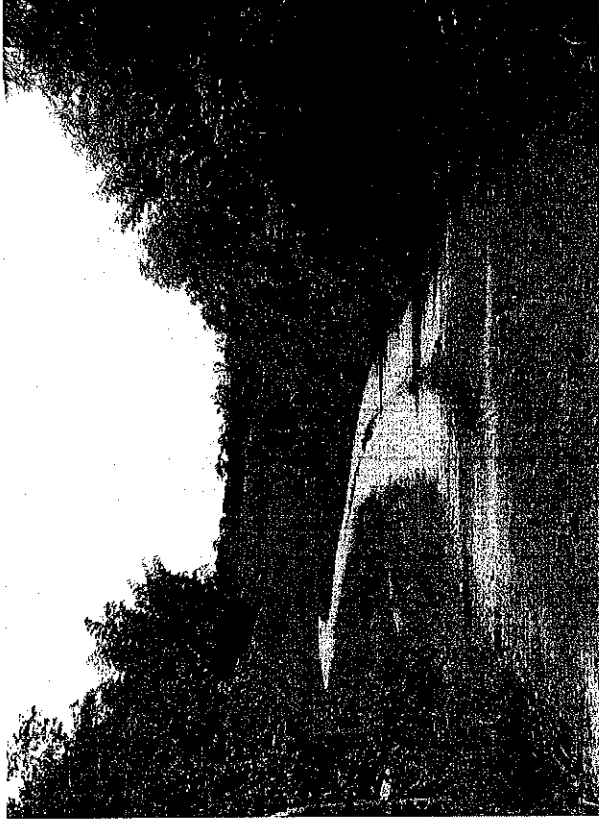
Imagen No 3. Vía carretable Numero DOS – vereda Cerritos