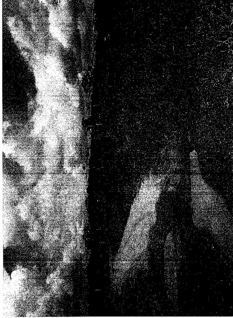
FOTOGRAFÍAS DE TALAS PNN SIERRA DE LA MACARENA -SENDERO ECOLOGICO POR LA PAZ