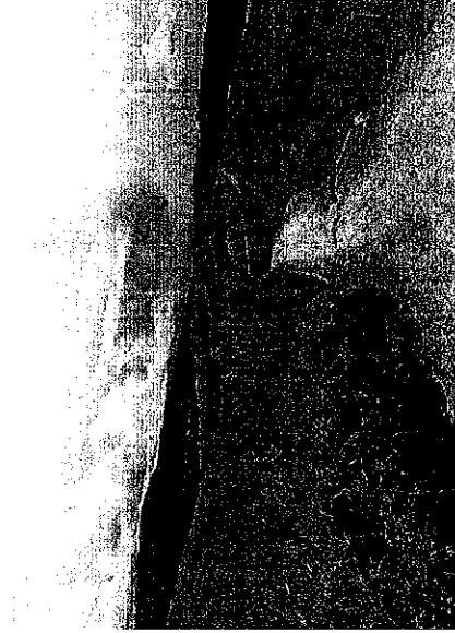
Imagen No 5. Vía carretable Numero CUATRO- Vereda Bocanas del Chiguiro.