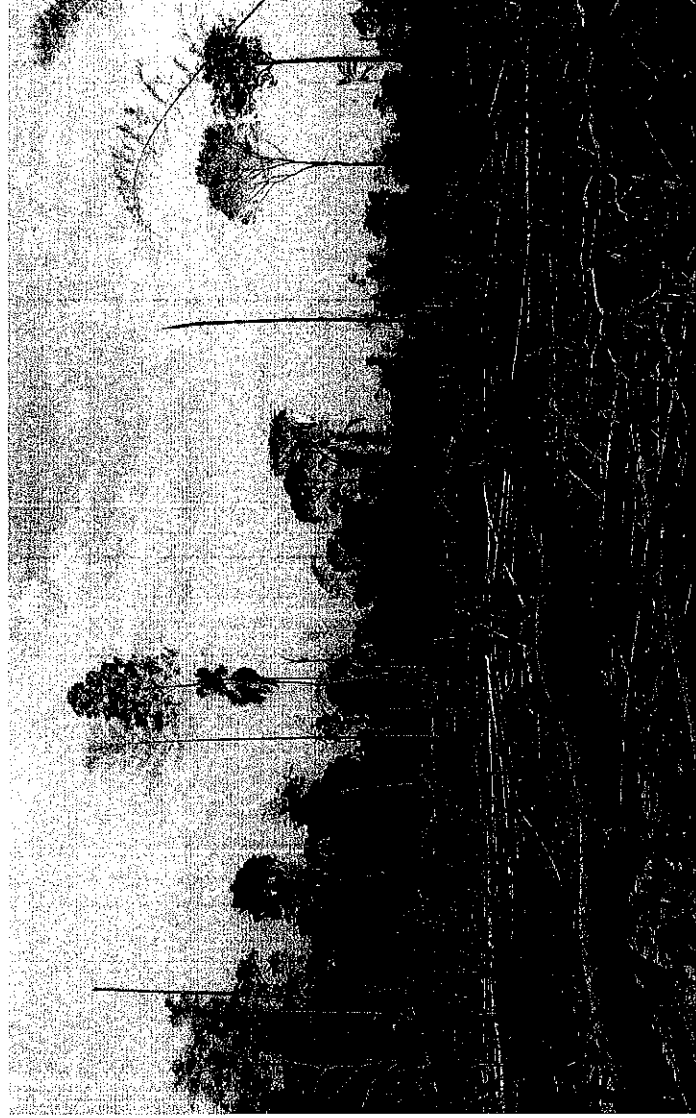
Quema de bosque primario en aproximadamente 60 hectáreas, coordenada 02°38'47.080" N 074°19'41.700" W.