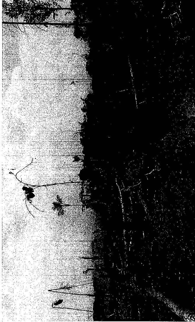
Quema de bosque húmedo tropical primario, 4 has afectadas, coordenada 02°37'27.370" N, 074°19'25.210" W

Continuando con la verificación se llegó a una caseta en la que se encontraban 6 personas de las cuales se observaron 2 con arma de fuego tipo pistola y fusil, al verlos se decide regresar por cuestiones de seguridad ya que para esta verificación se debía dejar las motos en este punto y caminar aproximadamente 1200 metros por la orilla del río guayabero abajo, por tanto no se pudo verificar los focos de calor. Las afectaciones al medio ambiente se reportan en el anexo No 4 en el ítem de observaciones.