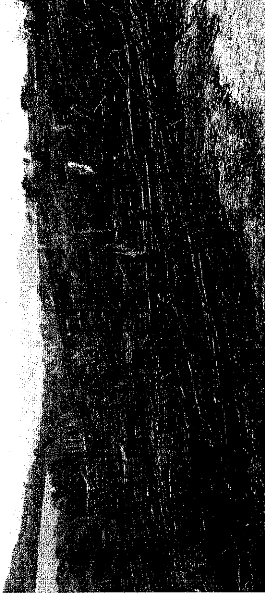
Panoramica de tala y quema de bosque con area aprox. 7 Has VDA Platanillo, cordenadas N 02°39'19.794" W 074°27'0.594" sector Platanillo Municipio de Uribe-Meta, 20/02/2018