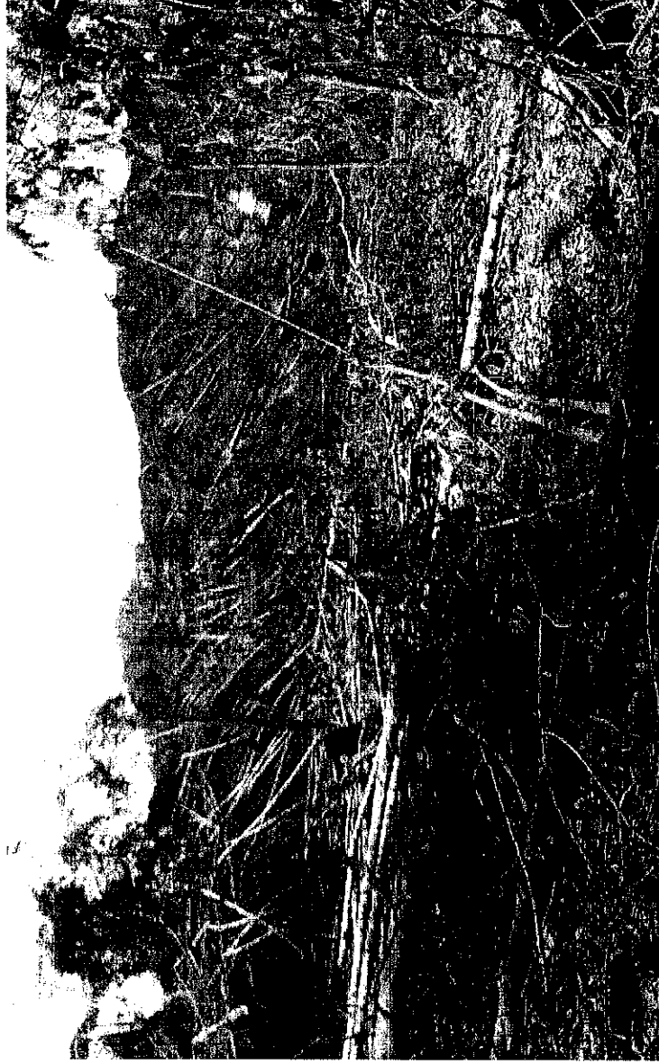
Panoramica de tala y quema de bosque secundario, area aprox. 8 has VDA Platanillo, coordenadas N 02°42'49.638" W 074°28'8.856"sector Platanillo Municipio de Uribe-Meta, 20/02/2018

Durante la ruta asignada al equipo numero dos no se evidencio presencia de miembros de la fuerza pública; se llegó al punto de encuentro de los cinco equipos a la hora estimada sin novedad, cumpliendo con un retorno exitoso a la hora 17:35 sede administrativa en San Vicente.