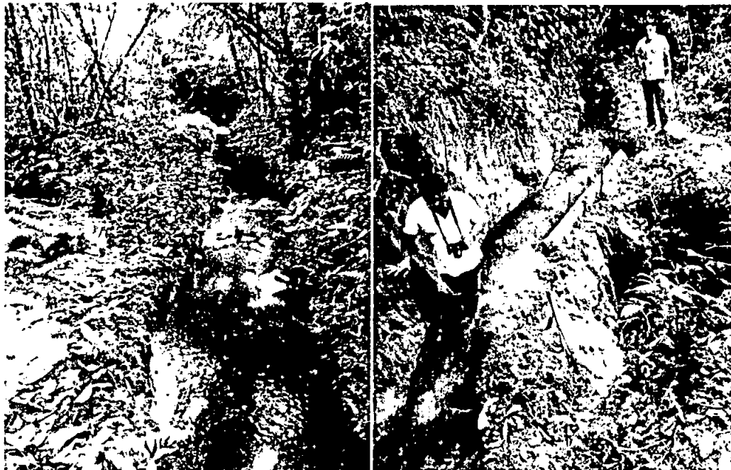
Foto 1. Canal Quebrada El Silencio

Se realizó un recorrido por un trayecto de 4.21 Km desde el Centro Vacacional hasta el tercer punto a intervenir, evidenciando que estos son tres puntos críticos que deben adecuarse con el fin de garantizar el suministro de agua no sólo al CRV Yanaconas, sino también a la vereda El Cabuyo, quienes también se abastecen de esta fuente hídrica aguas abajo.