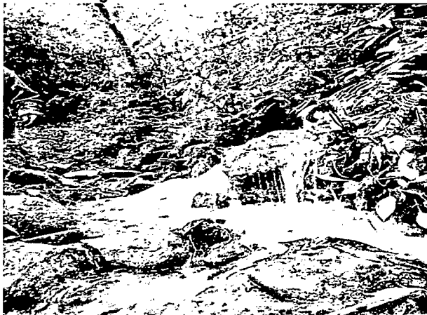
Imagen No. 2: Quebrada San Gabriel.

En la actualidad, la familia realiza actividades productivas como la agricultura y ganadería silvopastoril a menor escala. Así pues, la Reserva cuenta con cultivo de frutales, plantas aromáticas y pancoger. Al interior de la misma funcionan los siguientes sistemas: Un biodigestor, vivero de plantas aromáticas, ornamentales y nativas.