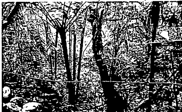
Imagen No. 1: Muestra de ecosistema presente en el predio "San Gabriel".

El predio "SAN GABRIEL" posee una muestra de ecosistema que corresponde a: "Bosques naturales del orobioma medio de los andes". Identificándose dos tipos de oberturas, la primera corresponde a bosques densos y la segunda corresponde a bosques fragmentados. Posee una importante conectividad ecológica con bosques vecinos, y una cercanía especial con el PNN MUNCHIQUE, otorgándole una importante función amortiguadora, lo que permite además la protección de fauna y flora silvestre permitiendo otras funciones ecosistémicas relacionadas con: la regulación del clima, la protección y regulación del recurso hídrico, la retención de nutrientes y la provisión de condiciones apropiadas para el desarrollo de poblaciones de especies de fauna y flora.