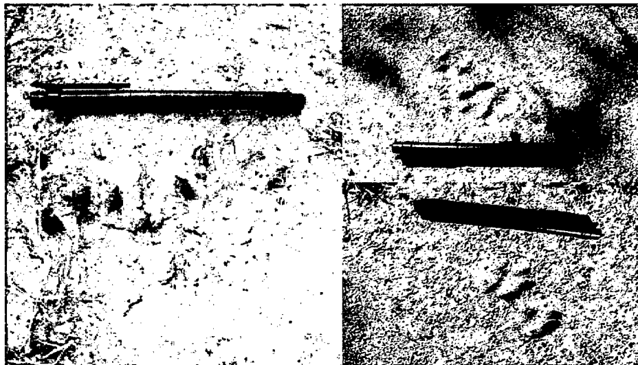
Huellas de mamíferos de la RNSC Bateas de la Cañada La Sucia.