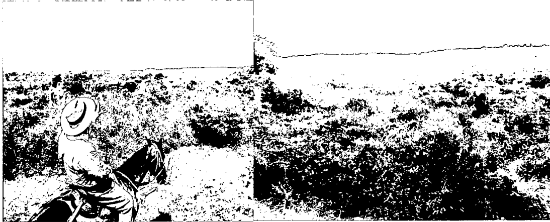
Vista panorámica del ecosistema de bosque seco de la RNSC Bateas Cañada de la Sucia.