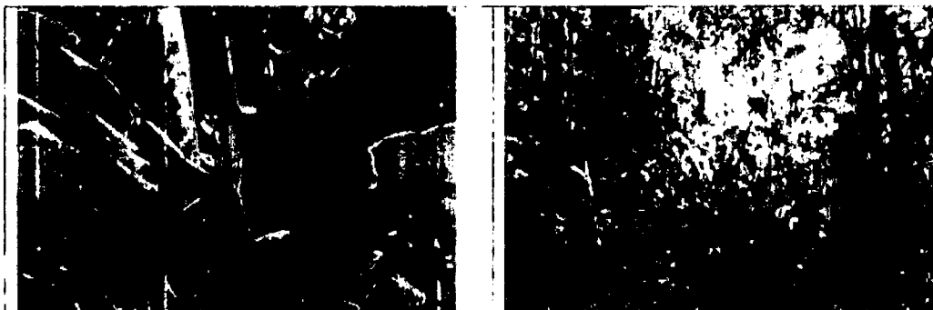
Imagen 1 Evidencias fotográficas del estado de conservación del ecosistema natural a proteger con la Reserva Natural de la Sociedad Civil denominada "La Guaca"

Con respecto a la flora, el mismo Informe Técnico de CORNARE (Folio 48) dice que: "(...) aún no se ha realizado un inventario forestal..."