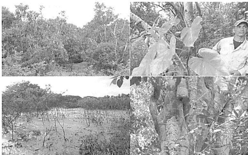
Continuación figura 5. Recorridos por los ecosistemas de la RNSC "PRAGA" durante la visita técnica. (...)"