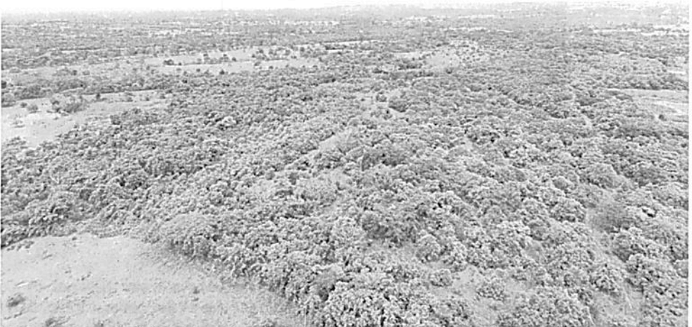
Figura 4. Bosque de Galería Basal Seco según la capa de Ecosistemas Continentales, Costeros y Marinos de Colombia 2017 del IDEAM 2017 versión 2.1 o Bosque Seco Tropical según la capa de Bosque Seco del IAvH, en el Predio Barcelona de la RNSC "PRAGA".