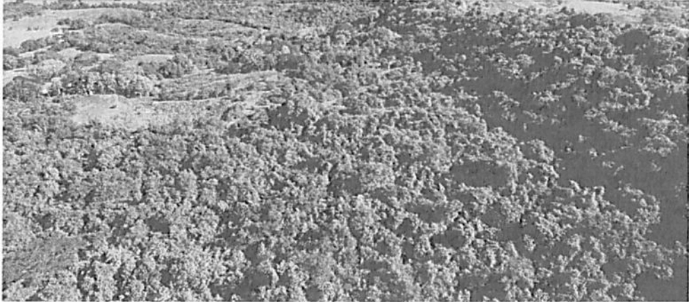
Figura 3. Ecosistema Subxerofitia basal según la capa de Ecosistemas Continentales, Costeros y Marinos de Colombia 2017 del IDEAM 2017 versión 2.1, en el predio Praga de la RNSC "PRAGA".