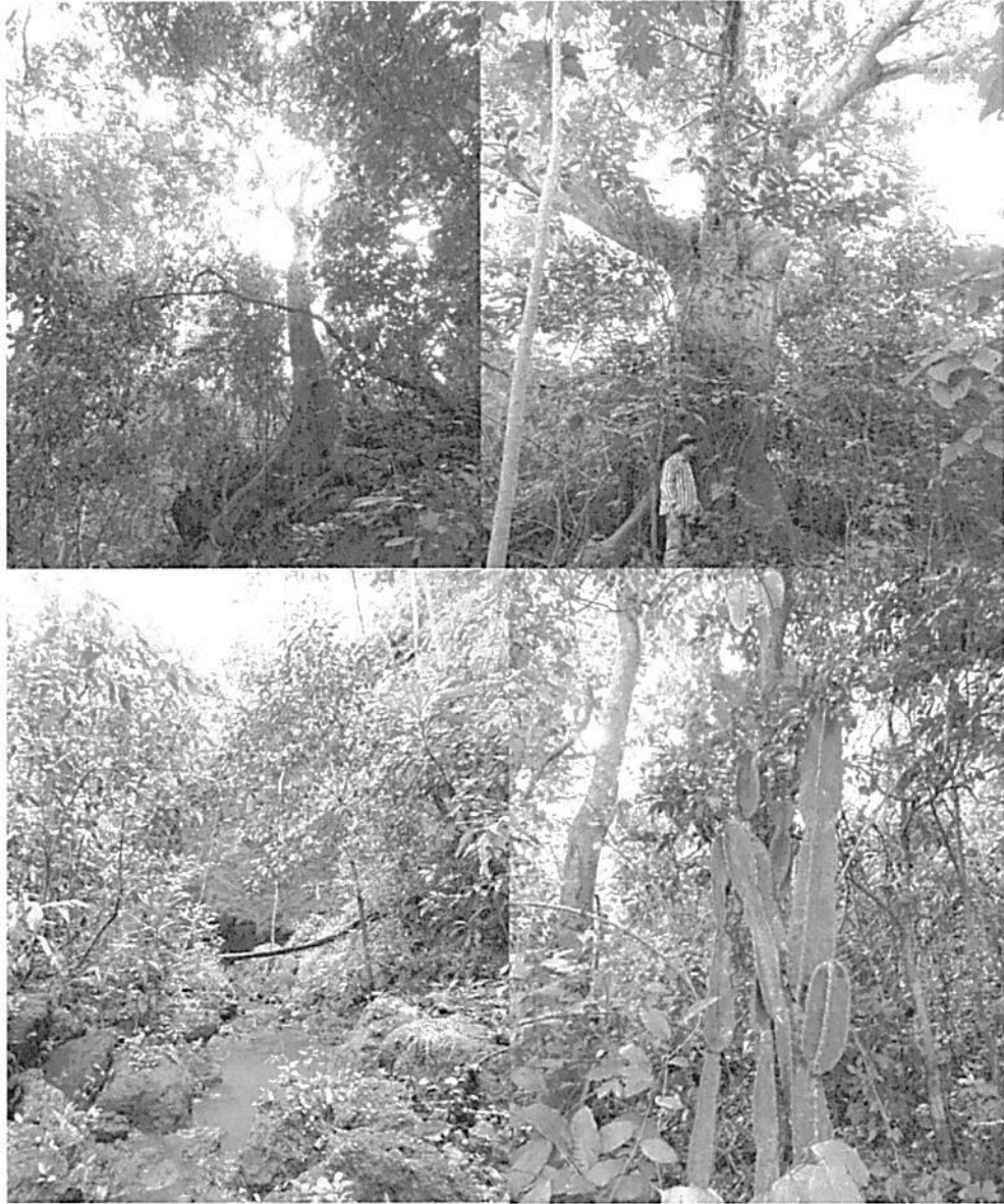
Figura 5. Recorridos por los ecosistemas de la RNSC "PRAGA" durante la visita técnica.