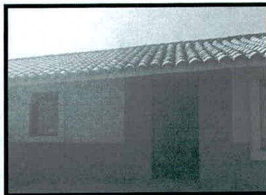
Foto 1 Zona de uso intensivo. Casa para turistas