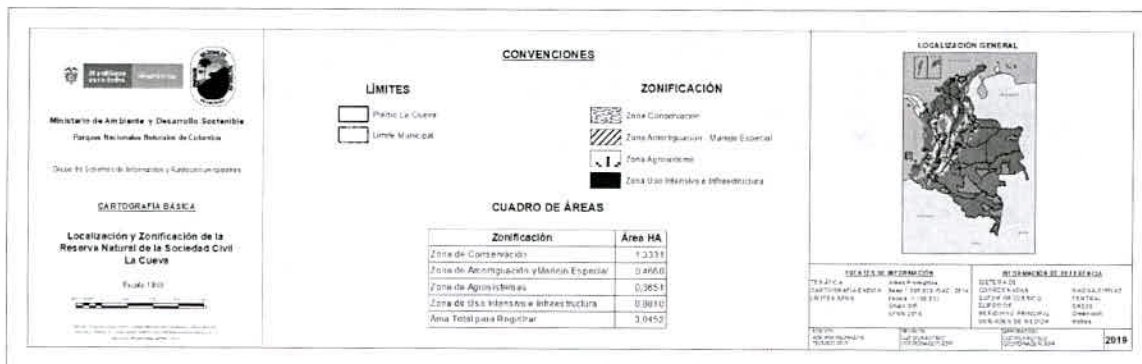
Mapa 1. Zonificación propuesta en el predio a registrarse como "RNSC La Cueva"