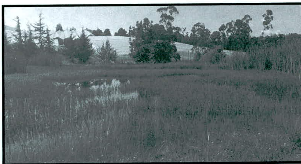
3. Zona de agrosistemas. Lombricultivo