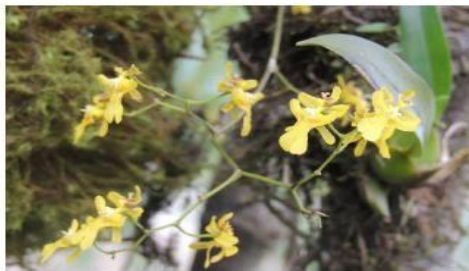
Oncidium ornitorrynchum (Cites II)