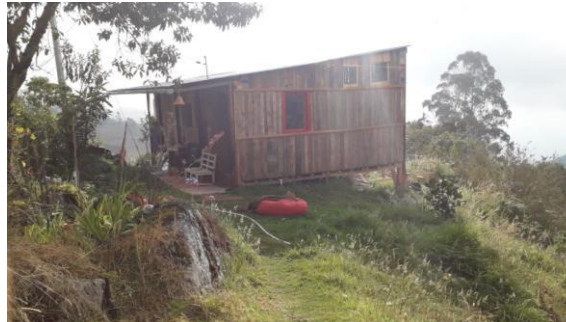
Vivienda principal del predio Maravillas. (Fuente: Concepto Técnico No. 20197030001503 del 22/07/2019 de la DTOR)

Con un área de 0,2340 hectáreas, equivalentes al 18,71 % del predio, este se distribuye en tres puntos correspondientes el primero a la casa principal, el segundo corresponde al área de parqueadero, el cual está en proceso de construcción y el tercero corresponde a una pequeña casa en la cual habitan los hijos de los propietarios.