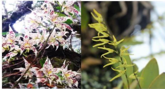
Oncidium cf blandum (Cites II)

Para este predio, se registraron varios géneros de orquídeas, entre ellos: Oncidium ornitorrynchum , Oncidium cf blandum , Anathallis angustilabia , entre otras. A continuación se muestran algunas fotos de la flora del predio: