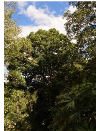
Fotos 1 y 2. Bosque Seco en La Esperanza en estado maduro.