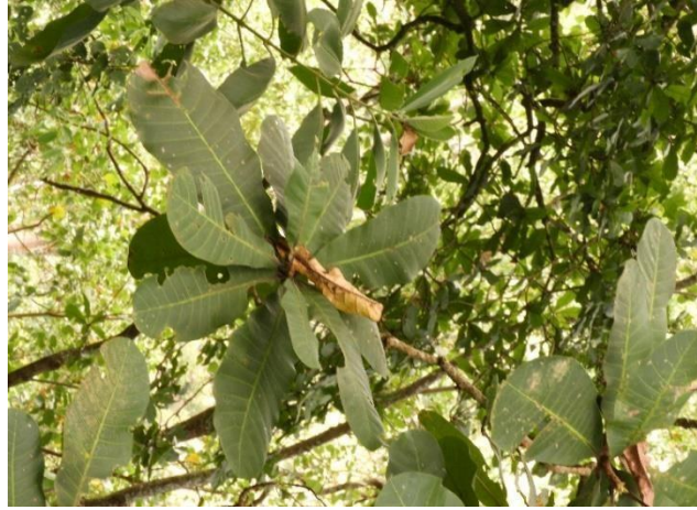
Fotos 3 y 4. Flora representativa en La RNSC La Esperanza. (caracolí). Fuente. Concepto Técnico No. 20196030002073 del 10 de septiembre de 2019.