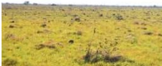
Figura 9. Sabanas naturales