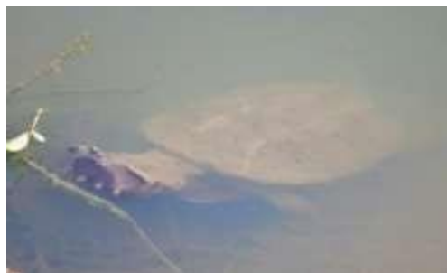
Figura 3. Tortuga mata-mata ( Chelus fimbriatus )