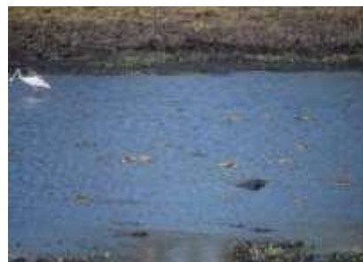
Figura 4. Babillas ( Caiman crocodylus )