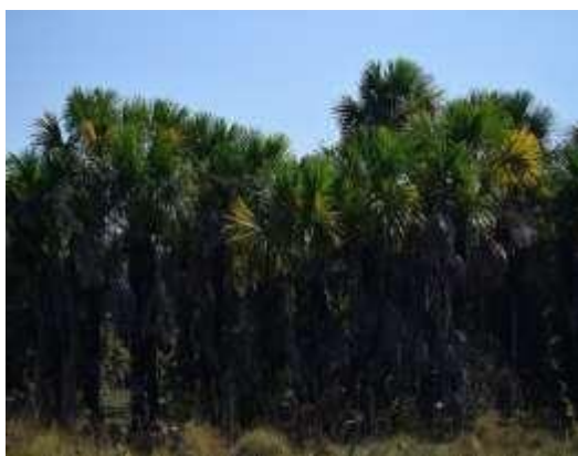
Figura 7. Morichal asociado a la cañada El Burro y al caño Paravare