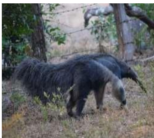
Figura 2. Oso palmero ( Myrmecophaga tridactyla )