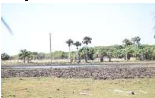
Figura 11. Zona pantanosa basal asociada al caño Paravare