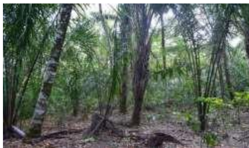
Figura 6. Palmar asociado al caño Duya