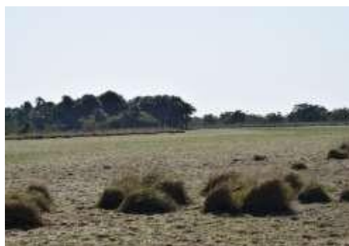
Figura 10. Sabana inundable asociada a la cañada El Burro