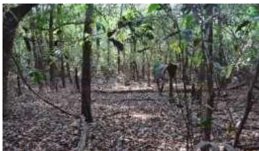
Figura 5. Bosque de galería inundable basal