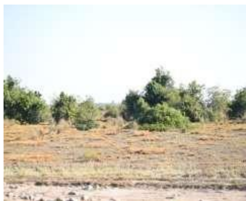
Figura 8. Ecosistema transicional transformado con coberturas de matorrales