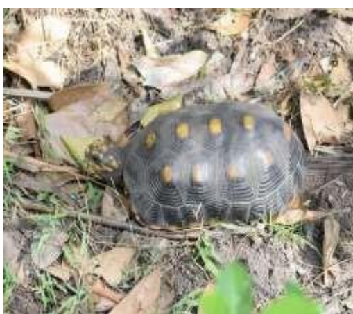
Figura 1. Morrocoy ( Chelonoidis carbonarius )

Durante la visita técnica, en los ecosistemas presentes en los predios se identificaron 111 especies de aves, 5 de mamíferos y 7 de reptiles (Tabla 2). Las especies más relevantes en términos de endemismo, amenazadas y especies clave o representativas de las sabanas inundables, fueron el morrocoy ( Chelonoidis carbonarius ) (Figura 1), y oso palmero ( Myrmecophaga tridactyla ) (Figura 2) que se encuentran en la categoría de amenaza Vulnerable (VU) de la UICN, así como el atrapamoscas ( Phelpsia inornata ) que es una especie endémica de las sabanas inundables. Otras especies que si bien no están amenazadas, cumplen un papel crítico en el mantenimiento de los ecosistemas naturales de los llanos tales como el mato ( Tupinambis teguixin ) que actúa en el control de poblaciones de otras especies, y primates como el mono aullador ( Alouatta seniculus ) fundamentales en el mantenimiento del bosque mediante la dispersión de semillas, así como especies acuáticas como la tortuga mata-mata ( Chelus fimbriatus ) (Figura 3) y las babillas ( Caiman crocodylus ) (Figura 4).