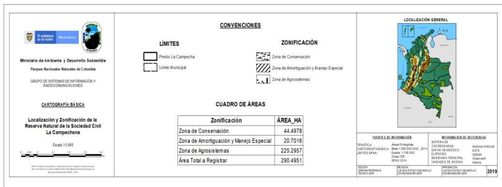
Mapa de Zonificación de la RNSC LA CAMPECHANA.