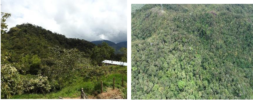
Foto Zona de Conservación Bosque muy húmedo – premontano (Bmh-Pm). Fuente: Concepto Técnico CORNARE No. 112-4882-2019 del 15/01/2020.