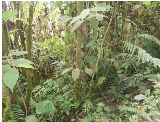
Panorámica del predio Palogrande