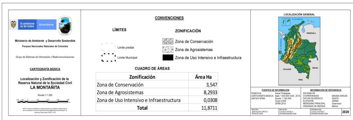
Figura 1. Ubicación y zonificación RNSC La MONTAÑITA.