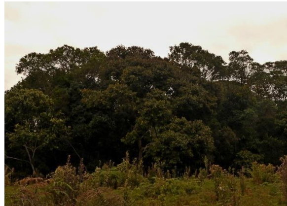
1 y 2. Vegetación presente en La RNSC LA MONTAÑITA (Fuente: Concepto Técnico DTAO No. 20206030000036 de 09/07/2020)