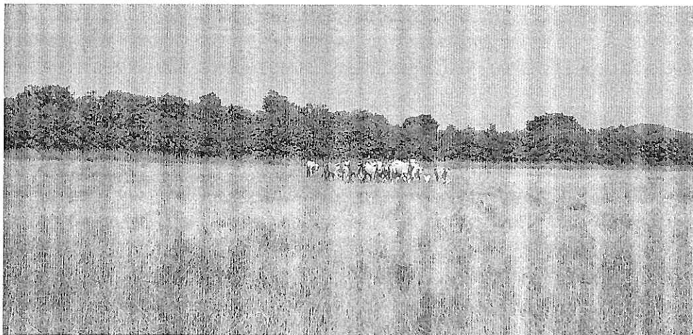
Ilustración 4.- ganado en la finca Aceitico: N5°09'.489' W67° 51.166'