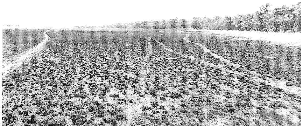
Ilustración 1.- Incendio: N5° 09'14.5" W67°52'24.3”

Que en dichos documentos se indica que “El día 22- enero -2020, Siendo las 8:30 am el equipo del Parque Nacional Natural El Tuparro, se desplazó desde el centro administrativo El Tomo, hasta la zona del Predio Aceitico, ubicada dentro del Parque, con el fin de realizar recorrido de PV y C y verificar posibles actividades no permitidas. Al llegar a la entrada del predio se evidenciaron rastros de un incendio y heces de ganado recientes, lo que se supone que el incendio está relacionado con la presencia de ganadería (coordenadas) N5° 09'14.5" W67°52'24.3”