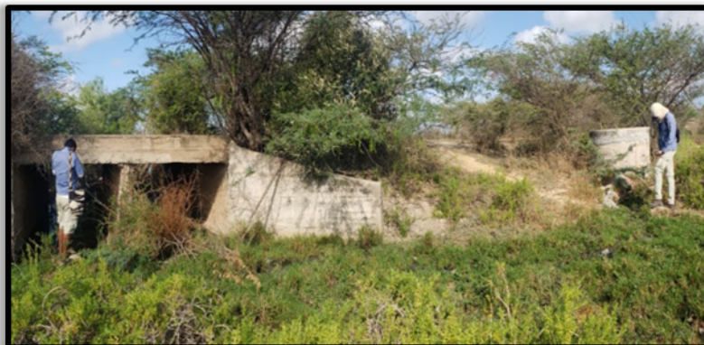
Figura 2. Conexión del vertimiento con box culvert