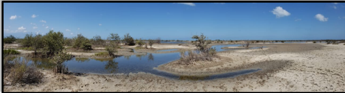
Figura 5. Conexión del vertimiento con la Laguna navío Quebrado