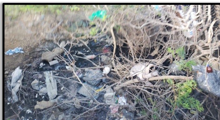
Figura 3. Disposición de Residuos Sólidos sobre box culvert