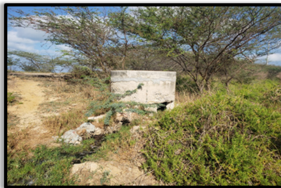
Figura 1. Inicio de vertimiento

Del registro fotográfico contenido en el Informe de Campo para Procedimiento Sancionatorio Ambiental No. 20206760001083, destacan las siguientes imágenes: