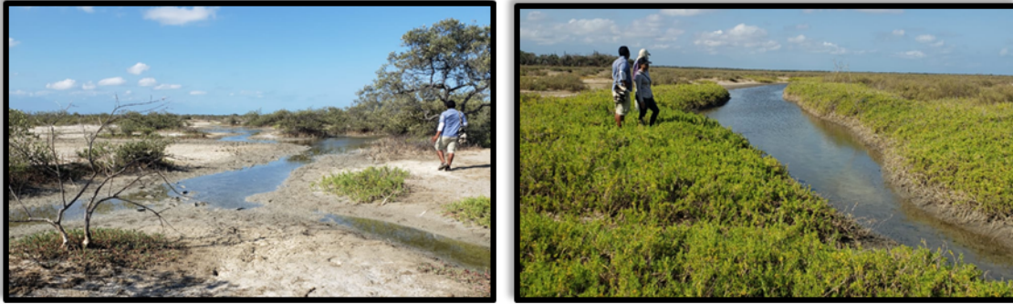
Figura 4. Recorrido de las aguas residuales sobre caño que conecta con la Laguna navío Quebrado

“Por el cual se inicia una investigación de carácter administrativo ambiental contra la ALCALDIA DISTRITAL DE RIOACHA y se adoptan otras determinaciones”