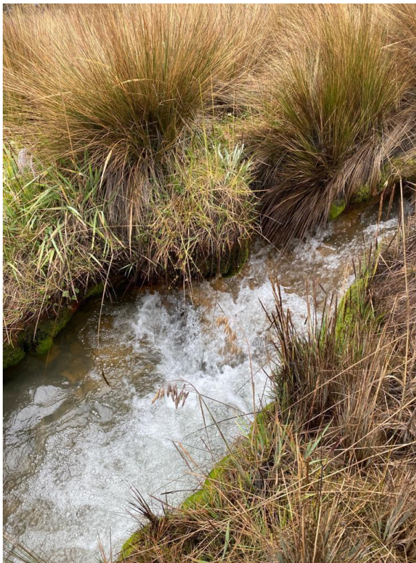
Ilustración 1. canalización artesanal Q. Alfómbrales

Aguas abajo se canaliza mediante una tubería en dos tramos y luego se conduce el recurso fuera del área protegida por medio de una acequia hasta llegar al predio, donde se canaliza por una tubería de 3” que conduce el recurso a una tanque de almacenamiento de cemento del cual se desprenden 4 mangueras de ½ ” que distribuyen el recurso.