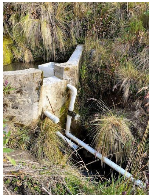
Ilustración 3. tubería de aducción.

Desde el tanque de almacenamiento de 1000 L se deriva un tubo PVC de 3" el cual recorre tres (3) metros aproximadamente hasta llegar a dos (2) tanques sedimentadores (que no se encuentran en funcionamiento), desde este punto otra tubería de 3" la cual recorre siete (7) metros hasta llegar a dos (2) tanques de cloración que no son funcionales, de allí se deriva una tubería de 3" en un recorrido de nueve (9) metros hasta llegar a tres (3) tanques de almacenamiento de 10000 L cada uno, desde allí se lleva el agua hasta el centro de inducción brisas por medio de la tubería de 2".