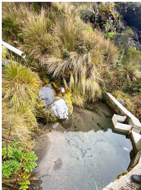
Ilustración 2. Sitio de captación represa en concreto

Actualmente en el punto de captación propuesto existe una represa construida en concreto, y por medio de tubo de Pvc de 3 pulgadas de diámetro se conduce el agua al primer tanque de almacenamiento de 1000 L que se encuentra ubicado a un kilómetro de la bocatoma. De esta bocatoma también se abastece la cabaña de control y vigilancia del sector brisas.