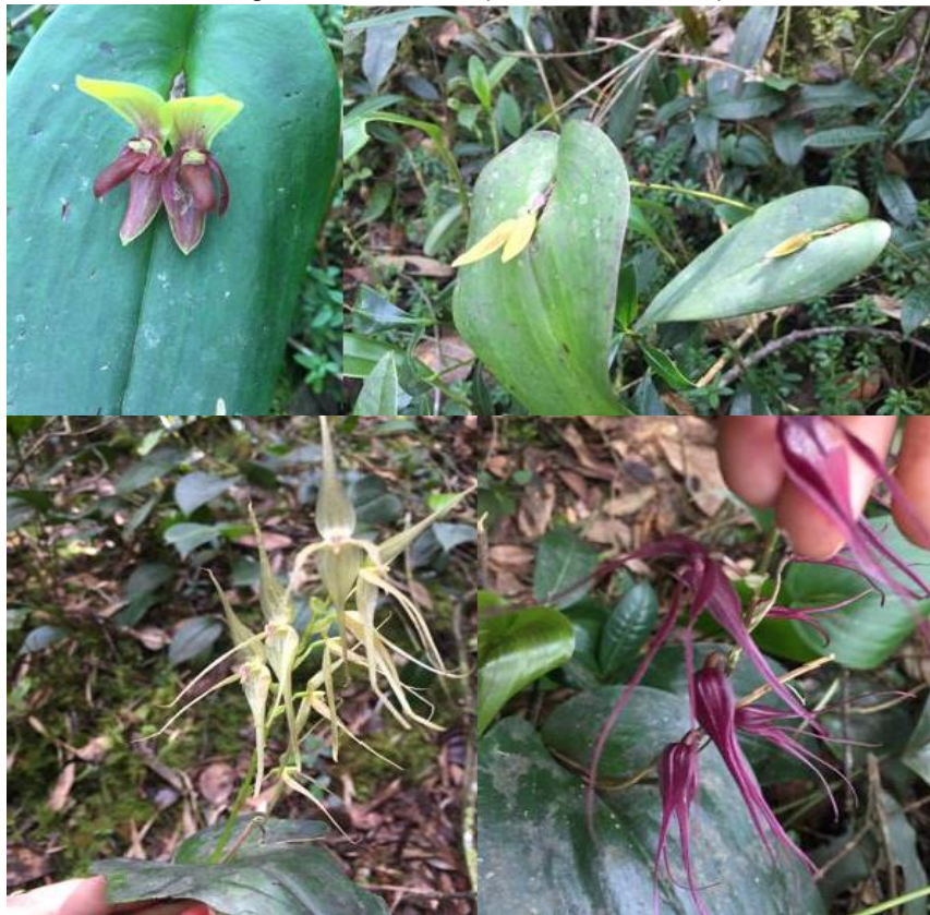
Imagen 3. Variedad de orquídeas Pleurothallis sp.

La RNSC LA ESPERANZA, alberga especies de flora típicas de las sabanas del centro del país en el departamento de Cundinamarca, cuyos ecosistemas se han ido transformando dada las presiones de la agricultura y la ganadería a través del tiempo. Se observaron parches de bosque seco montano bajo (bs-MB) en proceso de sucesión secundaria como: tuno, romero, higerón o caucho del tequendama, mano de oso, acasio, cucharo, pegamosco, variedades de musgos como el esfagno ( Sphagnum ), helechos, orquídeas ( Pleurothallis sp.) y quiches; se observó una buena capacidad de retención de agua a pesar de la presión causada por plantaciones de eucalipto de la zona; la RNSC LA ESPERANZA posee una buena conectividad con la RNSC "EL ENCUENTRO" 096-18 a través de su zona de conservación dado que son colindantes, favoreciendo la oferta de servicios ecosistémicos en la región como la protección de hábitats para especies de aves, regulación hídrica y climática entre otros.