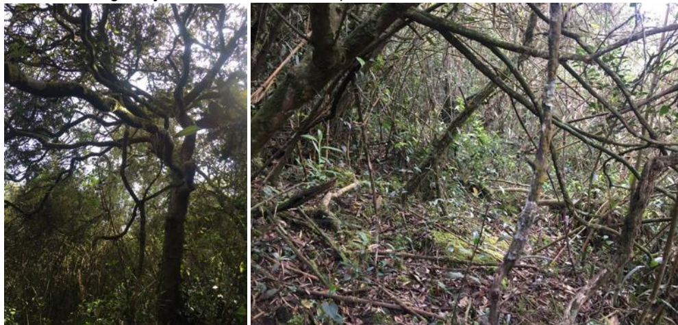
Imagen 1 y 2: Muestra de ecosistema presente en la RNSC LA ESPERANZA.

De acuerdo con la descripción de zonas de vida o formaciones vegetales del área jurisdiccional de la CAR 1 , y lo evidenciado en campo, el predio objeto de estudio posee una muestra de ecosistema correspondiente a Bosque Seco Montano Bajo (bs – MB), con una temperatura promedio entre los 12 y 18°C, un promedio anual de lluvias de 500 a 1000 mm; este tipo de ecosistema se localiza en un rango altitudinal entre los 2.000 y 3.000 msnm, específicamente el predio en proceso de registro se ubica entre los 2600 y 2900 msnm.