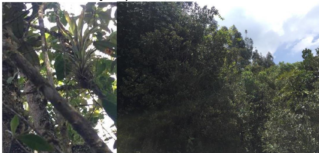
Imágenes 4 y 5. Quiches, zona de conservación.