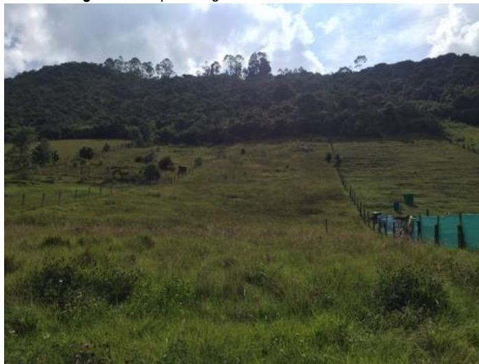
Imagen 6. Perspectiva general RNSC LA ESPERANZA.