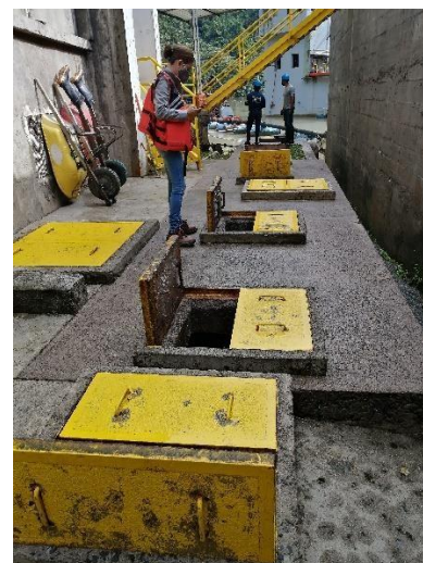
Fotos 1 y 2. Tanque Séptico Base Militar y Sistema Séptico Taller Draga