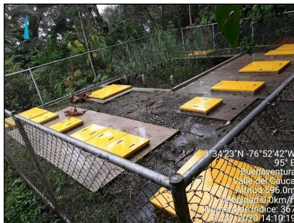
Foto 1. Sistema Séptico Campamento Yatacué

El Sistema de Tratamiento cuenta con 3 tanques sépticos, uno recoge las aguas residuales del casino, y el otro para las instalaciones Militares y el último para tratar todas las aguas recolectadas del campamento Yatacué.