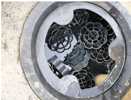
Foto 2. Material filtrante