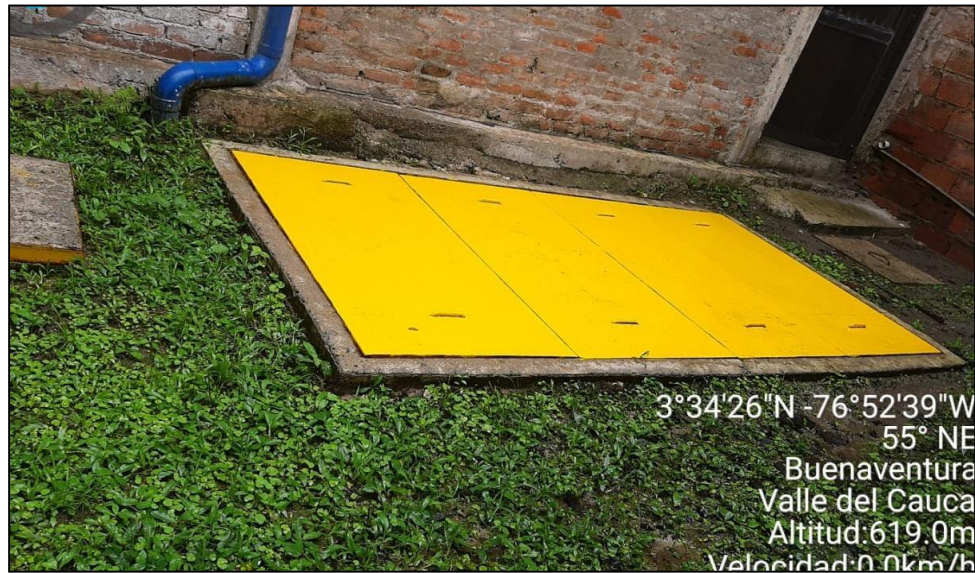
Foto 1. Sistema Séptico Oficina Automotriz No. 2

El Sistema de Tratamiento cuenta con 1 tanque séptico con capacidad de 2000 litros, que recibe las aguas servidas de oficinas automotriz No. 2 y resultantes del lavado de vehículos.