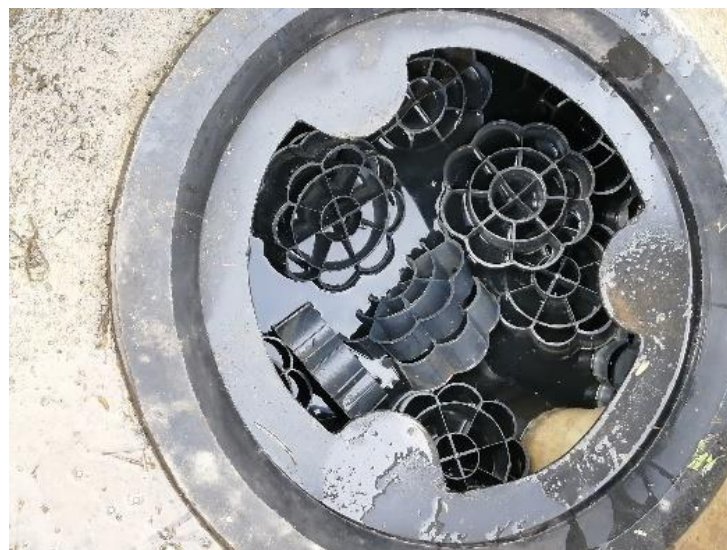
Foto 2. Material filtrante

El Sistema cuenta con un tanque Filtro Anaerobio de Flujo Ascendente de capacidad 4000 litros y recibe las aguas de los pozos sépticos, este elemento permite una remoción mayor de las cargas contaminantes del agua residual.