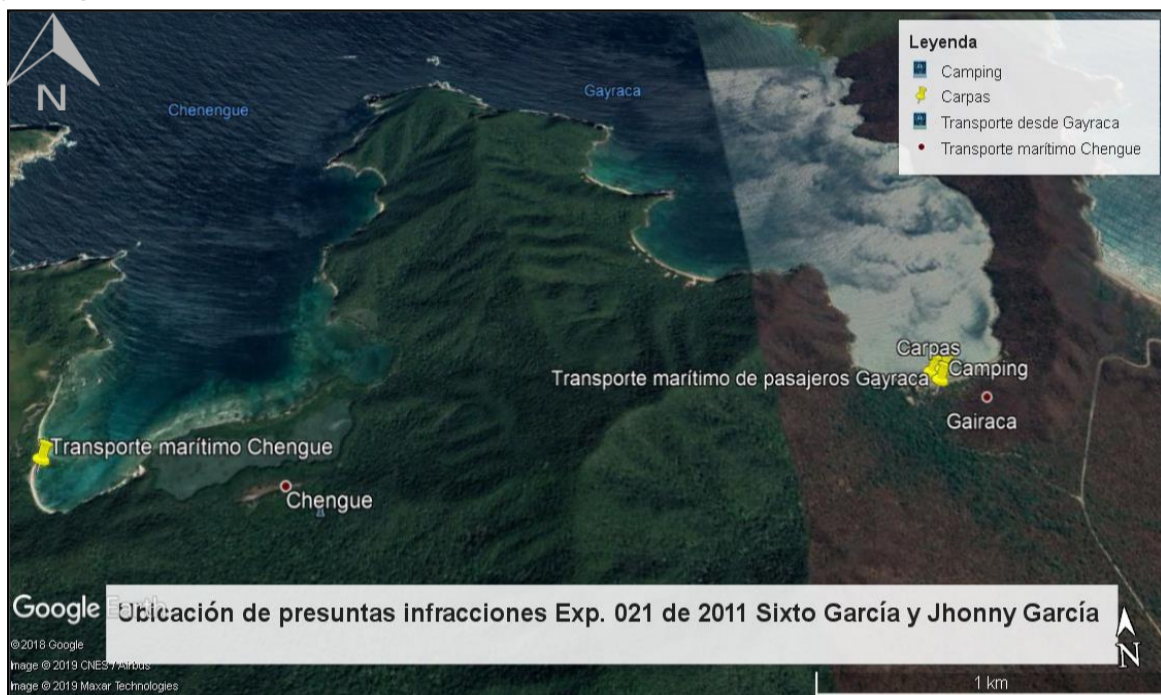
Figura 1, ubicación de las carpas, camping y Transporte de personal de Gayraca – Chengue y viceversa. Proyecto Ana María Valderrama.

La infracción se ubica en las coordenadas 11°19'4.74" N – 74°6'28.27" W Carpas Playeras, 11°19'3.54" N – 74°6'27.64" W Servicio de Camping, 11°19'4.98" N – 74°6'26.81" W Transporte Marítimo Pasajeros Gayraca y 11°19'0.70" N – 74°8'8.44" W Transporte Marítimo Pasajeros Chengue (Figura 1), en el sector de Gayraca y Chengue.