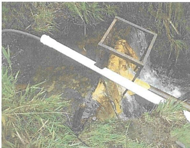
Ilustración 1. Bocatoma Campamento Chuza

La Empresa de Acueducto y Alcantarillado de Bogotá instaló un macromedidor que permite conocer el caudal captado.