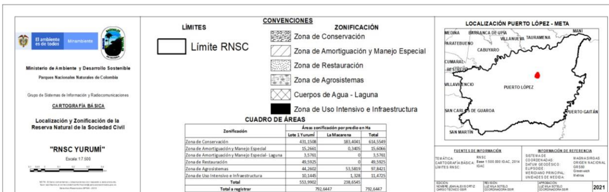
Figura 7: Nueva zonificación de la Reserva Natural de la Sociedad Civil “YURUMI”.