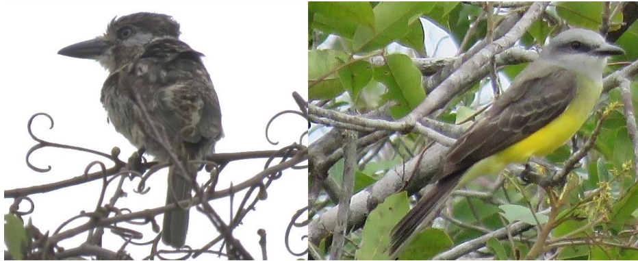
Continuación Figura 4. Aves observadas en la RNSC "YURUMI". Fuente visita técnica PNNC 15 al 18 de marzo de 2021.