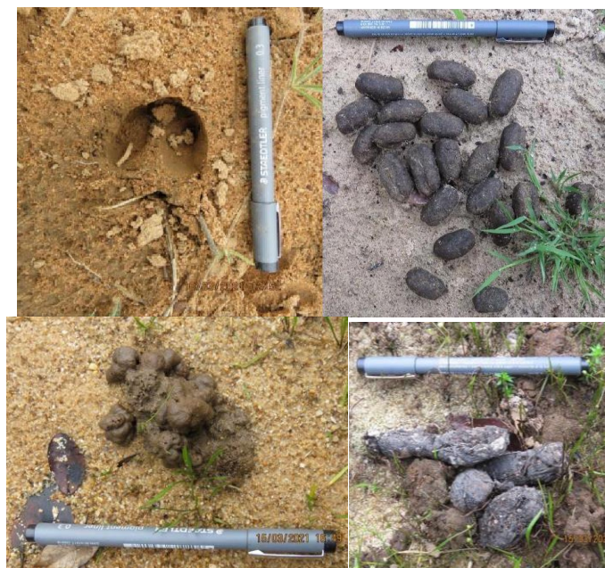
Figura 5. Observaciones directas e indirectas de mamíferos en la RNSC "YURUMI".