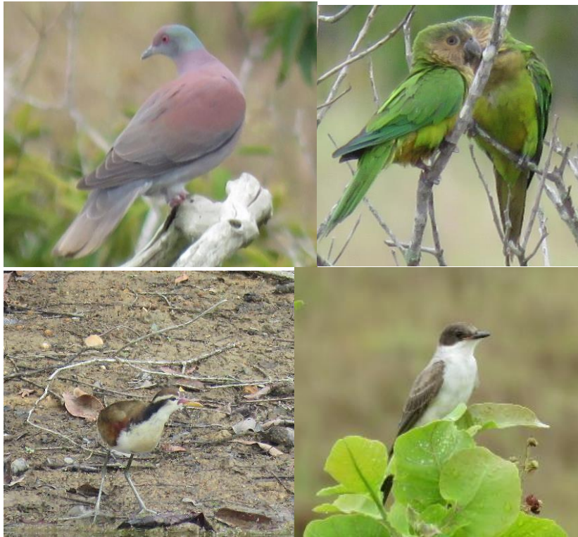
Continuación Figura 4. Aves observadas en la RNSC "YURUMI".