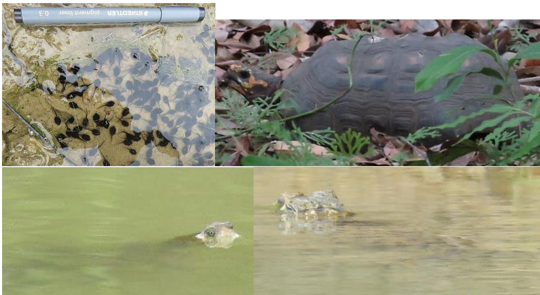
Figura 3. Herpetofauna observada en la RNSC “YURUMÍ”.

Durante la visita técnica al predio "Lote 1 Yurumí" identificado con FMI 234-21197 registrado inicialmente como RNSC “YURUMÍ” y al predio "Lote 2 La Macarena" identificado con FMI No. 234-21198 que conforma la solicitud de modificación del registro de la RNSC “YURUMÍ” se hicieron observaciones directas de anfibios y reptiles (Figura 3), de aves (Figura 4) y directas e indirectas de mamíferos (Figura 5). Adicionalmente, los propietarios de la reserva remitieron imágenes de mamíferos capturados con cámaras trampa (Figura 6).