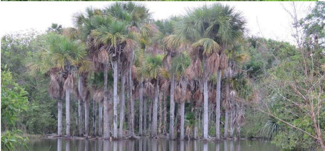
Continuación Figura 1. Muestra de ecosistema natural presente de Bosque de galería y Morichal, observados en el predio "Lote 1 Yurumi" identificado con FMI 234-21197 y predio "Lote 2 La Macarena" identificado con FMI No. 234-21198 que conforman la solicitud de modificación del registro de la RNSC "YURUMÍ". Fuente visita técnica PNNC 15 al 18 de marzo de 2021.