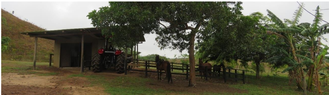
Figura 9. Parte de la zona de uso intensivo e infraestructura de la RNSC “YURUMÍ”.