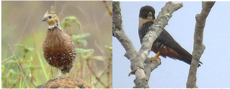
Continuación Figura 4. Aves observadas en la RNSC "YURUMI".