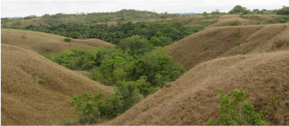
Figura 1. Muestra de ecosistema natural presente de altillanura disectada o serranía, observada en los predios "Lote 1 Yurumi" identificado con FMI 234-21197 y predio "Lote 2 La Macarena" identificado con FMI No. 234-21198 que conforman la solicitud de modificación del registro de la RNSC "YURUMÍ". Fuente visita técnica PNNC 15 al 18 de marzo de 2021.