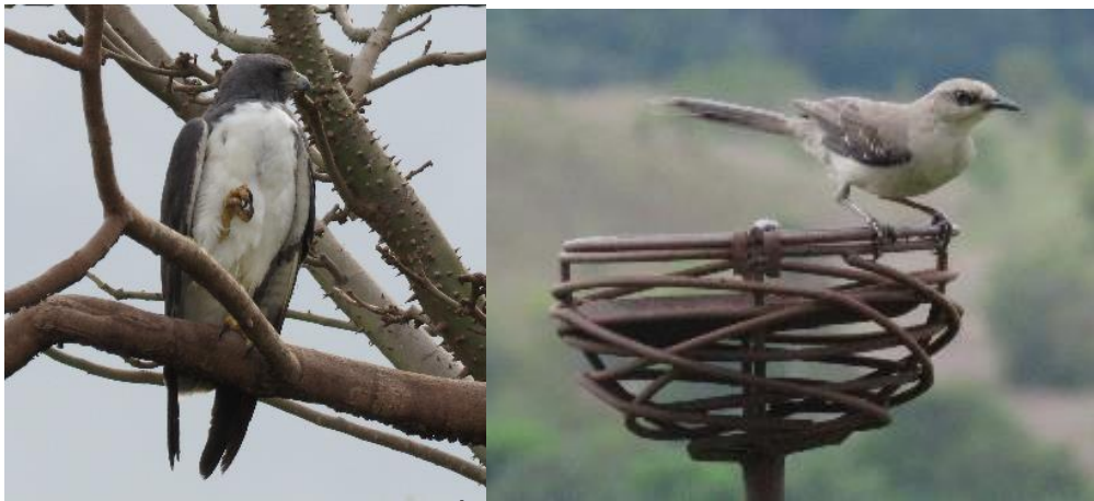
Figura 4. Aves observadas en RNSC "YURUMÍ". Fuente visita técnica PNNC 15 al 18 de marzo de 2021.