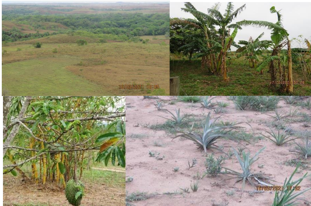
Figura 8. Zona de agrosistemas de la RNSC “YURUMÍ”.