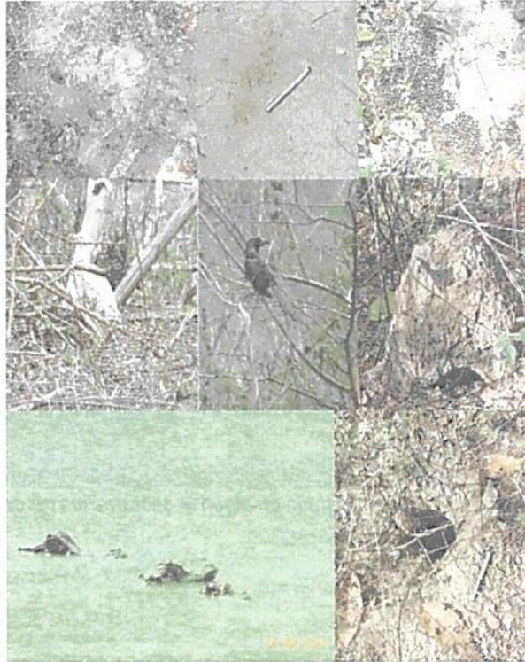
Figura 2. Algunos registros de fauna tomados en los recorridos.