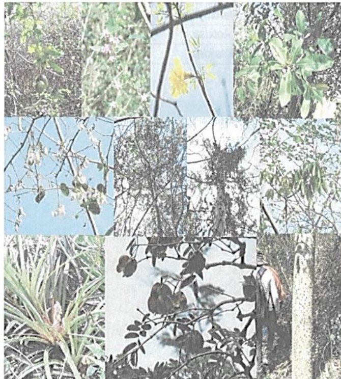
Figura 3. Parte de la vegetación encontrada en algunos sectores los recorridos.