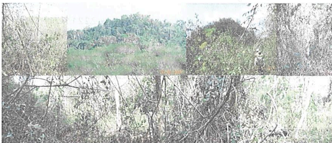
Figura 1. Aspecto de la vegetación presente en varios sectores del predio Calleja.