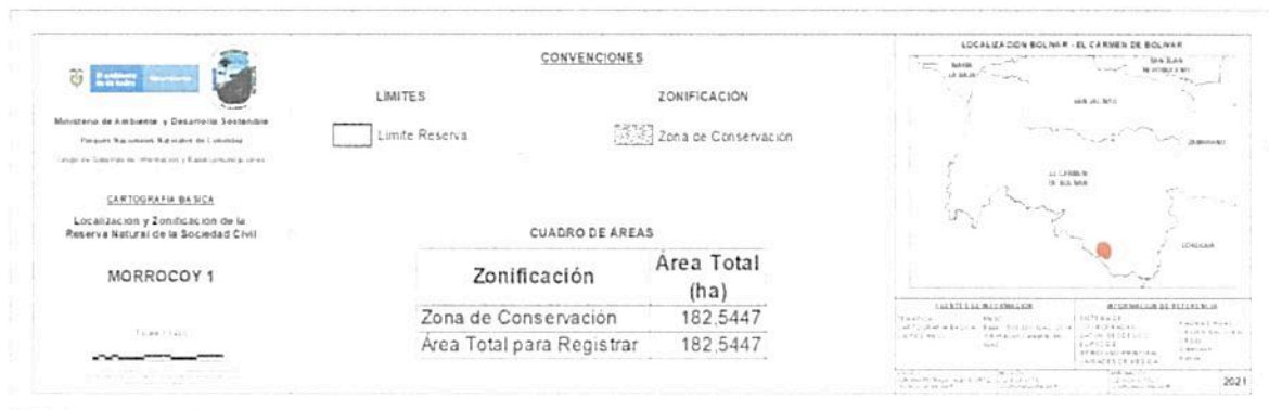
Figura 6. Zonificación para la RNSC "MORROCOY 1". Fuente: Grupo de Trámites y Evaluación Ambiental