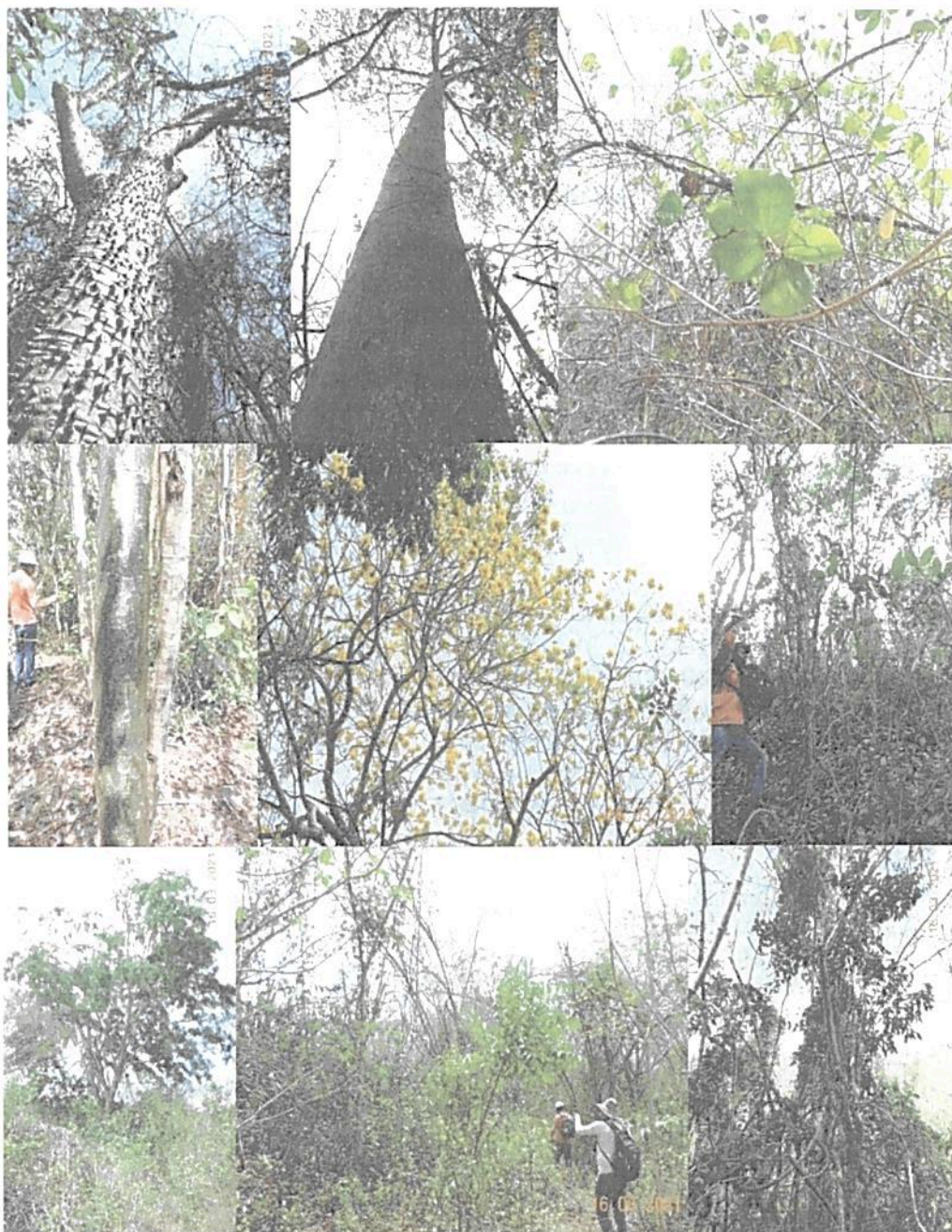
Figura 4. Muestra de vegetación presente en el predio "Calleja"