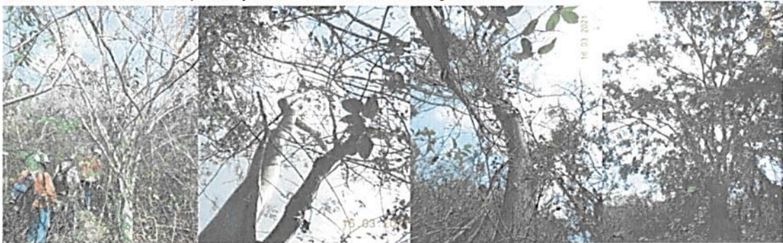
Figura 5. En varios sectores de la Reserva se encuentran árboles de gran porte.

Corresponde a la totalidad del área de registro 182,5447 (100%) y comprende un arbustal denso con varios sectores de bosque abierto en recuperación, que contiene varios individuos de gran porte y representativos del Bosque Seco Tropical (BsT), de igual forma se incluye un cuerpo de agua léntico ubicado al suroriente del predio y donde se encontraron algunas babillas.