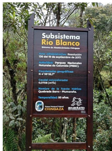
Fotos 1, 2.y 3 Quebrada Barro Plumarana