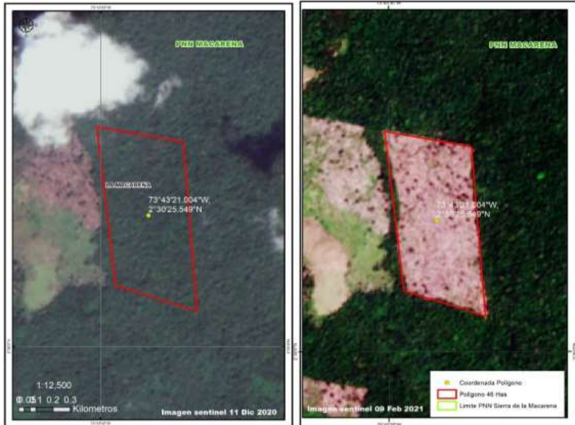
Figura 5. Imágenes Sentinel 2 muestran polígonos antes y después de la pérdida de bosque al interior del Parque Nacional Natural Sierra de la Maracrena, 2021.