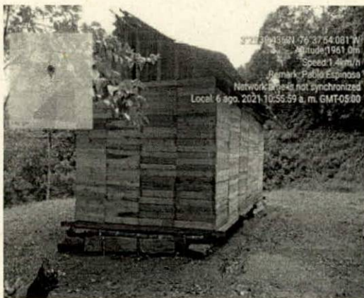
Fotografía 1. Construcción en madera de pino con techo en zinc para vivienda.

NOVENO: Que el 06 de agosto de 2021, el grupo operativo del PNN Farallones Cali realizó una visita de seguimiento a la infracción, evidenciando que “se encuentra una adecuación de un terreno de más o menos una plaza, la cual tiene una mejora hecha en madera reciclada como estibas hechas en pino, la cual usan como paredes, y techo en zinc, 10 tejas para vivienda; cuenta con un tanque para suministro de agua, el cual sirve para alimentar otras posibles viviendas. No tiene fluido eléctrico, no se observan baños ni pozo séptico. Se observa mantenimiento jardinería y huerta. Tiene un letrero que dice propiedad privada y no se encontró persona alguna.” Se adjuntan en el informe las siguientes fotografías: