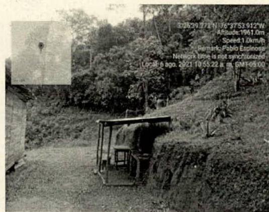
Fotografía 2. Cocineta y lavadero improvisado, sin desagüe.