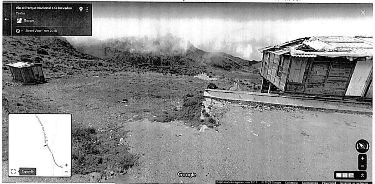
Gráfico 2. Sitio de filmación de la actividad en una zona de Alta Densidad de Uso del PNN Nevados.

Cronograma de la actividad de registro audiovisual