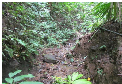
Quebrada Aguas Frías.