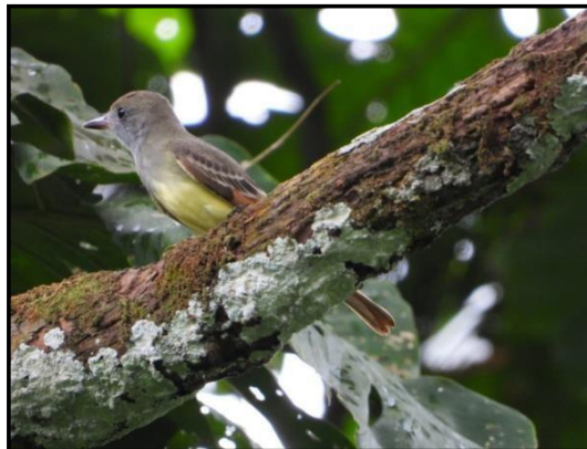
Atrapamoscas Myiarchus Tyrannulus