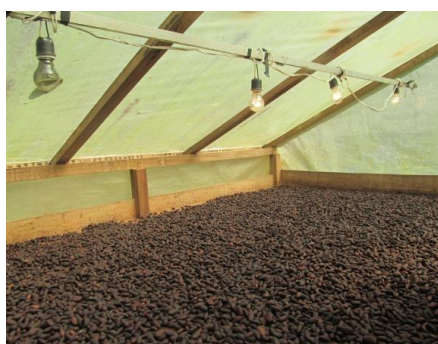
Zona de fermentación de material vegetal

Según lo expresado por el propietario y lo hallado durante la visita técnica por parte CORPOURABA se define la siguiente zonificación para la RNSC LA RIVERA: