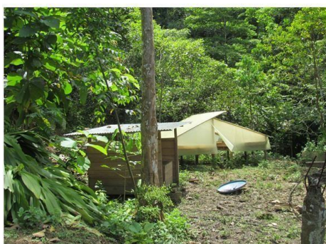
Marquesina de secado de café