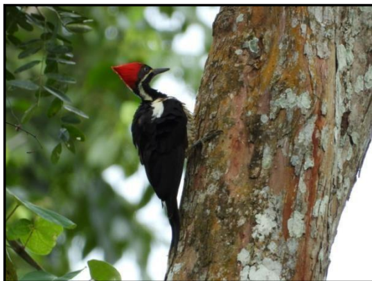
carpintero gigante Campephilus pollens