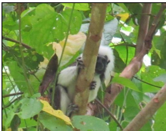
Titi piel roja saguinus oedipus