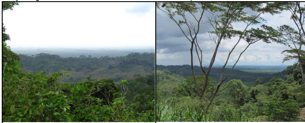
Panorámica desde el predio La Rivera. Zona de Conservación.

Igualmente la reserva La Rivera contribuye a la conservación de relictos de bosque húmedo tropical que tienen conectividad con la serranía de Abibe y que se encuentran inmersos en el Distrito Regional de Manejo Integrado Serranía de Abibe declarado recientemente por CORPOURABA.