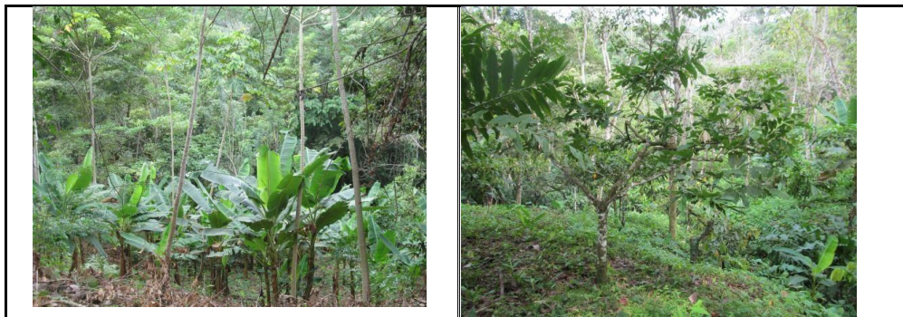
Cultivos de plátano y cacao con sombrío