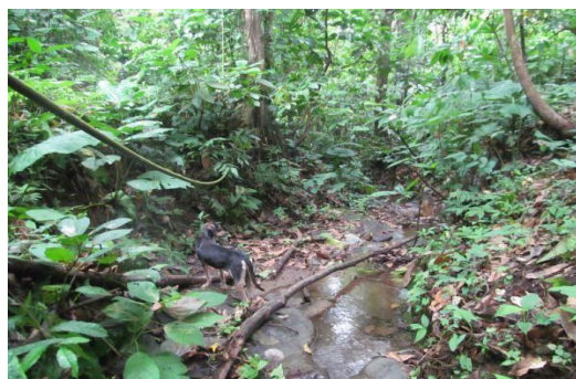
Quebrada La Teca

Esta zona comprende las áreas circundantes y perimetrales a las fuentes hídricas que atraviesan el predio o que discurren por un costado de este: Quebrada Aguas Frías localizada en el límite norte, Quebrada La Teca sector nororiental y Quebrada La Rivera en el sector central. El área de amortiguación comprende 2,9443 Ha las cuales se encuentran cubiertas por vegetación secundaria y bosque ripario.