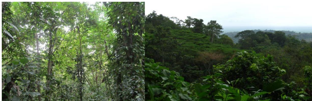
Relictos de bosque predio La Rivera

Según el mismo informe de CORPOURABA, al respecto de la flora se dice: "presencia de algunas especies como Choibá Dipteryx oleifera e higuera Ficus sp. , Parasiempre Chloroleucon sp. , Caracoli Anacardium excelsum , entre otros".