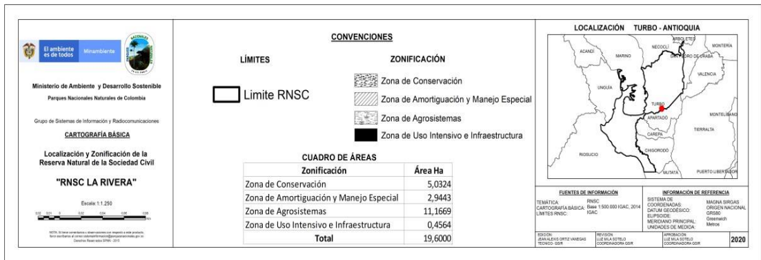
Mapa 1. Zonificación de la RNSC LA RIVERA.