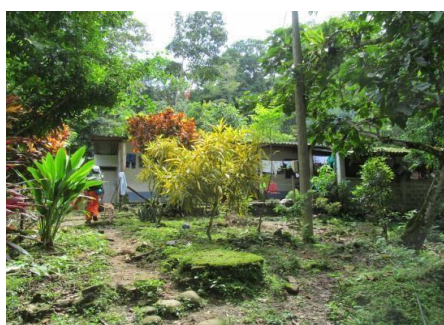
Vivienda predio La Rivera